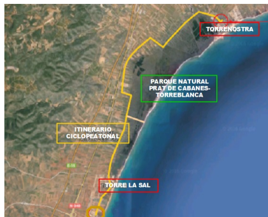
Itinerari per a ciclistes i vianants del Prat de Cabanes-Torreblanca

El Prat de Cabanes-Torreblanca (Castelló) és un Parc Natural de gran interès ecològic conegut per les nombroses rutes que reuneixen multitud d'atractius culturals, històrics i paisatgístics per al visitant. Amb la finalitat de posar en relleu el seu patrimoni natural i cultural, i connectar a la població amb els espais naturals a través de rutes amb bicicleta o a peu , s'han dut a terme les actuacions necessàries per a la construcció d'una nova ruta per a ciclistes i vianants entre els termes municipals de Cabanes i Torreblanca i que uneix els nuclis costaners de Torre de la Sal i Torrenostra .