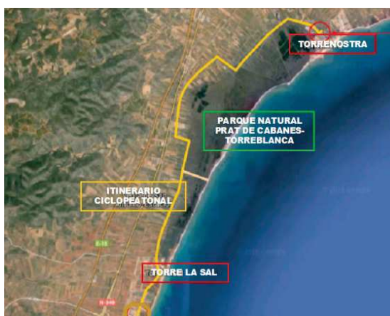
Recorrido del Itinerario ciclo-peatonal del Prat de Cabanes-Torreblanca

El Prat de Cabanes-Torreblanca (Castellón) es un Parque Natural de gran interés ecológico conocido por las numerosas rutas que reúnen multitud de atractivos culturales, históricos y paisajísticos para el visitante. Con el fin de poner de relieve su patrimonio natural y cultural, y conectar a la población con los espacios naturales a través de rutas en bicicleta o a pie , se han llevado a cabo las actuaciones necesarias para la construcción de una nueva ruta ciclo-peatonal entre los términos municipales de Cabanes y Torreblanca y que une los núcleos costeros de Torre de la Sal y Torrenostra .