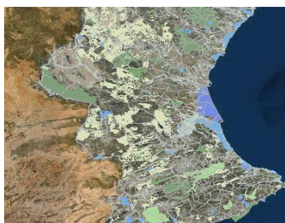
Visor infraestructura verde

Se han elaborado cartografías territoriales de: suelos críticos para la recarga de acuíferos, conectores territoriales, suelos por debajo del nivel del mar, la permeabilidad del territorio, y las masas de agua amenazadas con la intrusión salina.