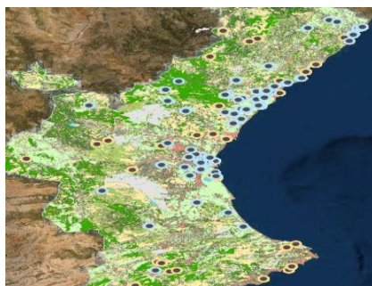
Visor infraestructuras educación ambiental