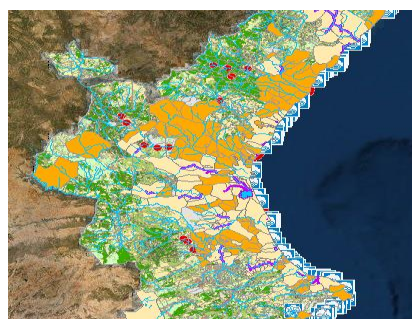
Visor calidad de las aguas