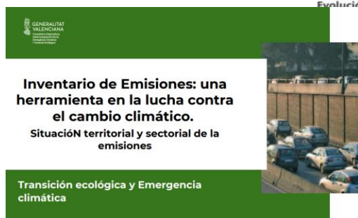
Evolución de las emisiones de CO 2 eq a la Comunitat Valenciana. Análisis por sector y propia.