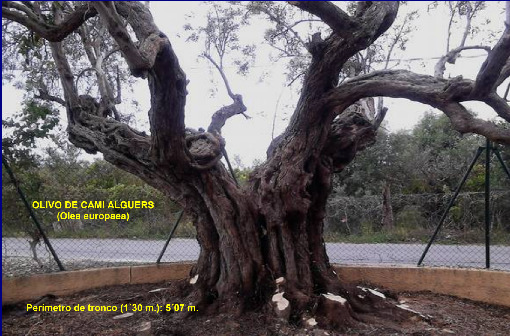
OLIVO DE CAMI ALGUERS ( Olea europaea )