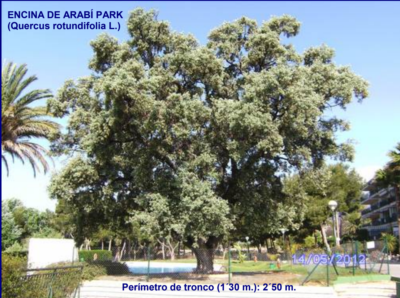
ENCINA DE ARABÍ PARK ( Quercus rotundifolia L.)