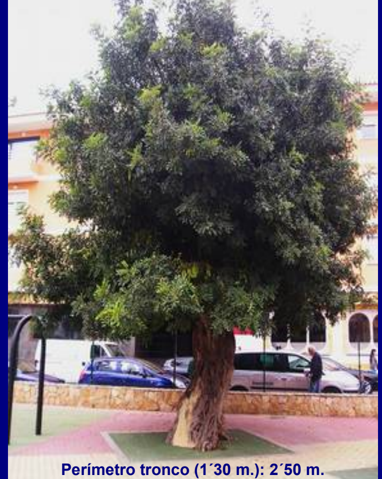
GARROFER DEL PARQUE DEL PLÁ ( Ceratonia siliqua L.)