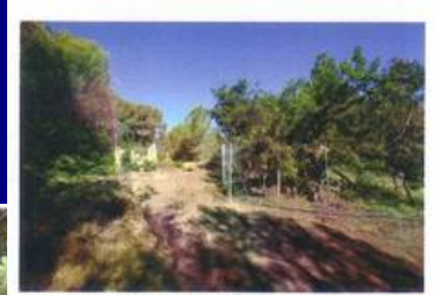
2. Estado tras actuaciones (19/07/12).