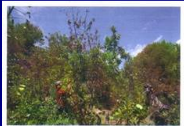
4. Poda de ramas jóvenes secas por roeduras en la corteza.

5. Trampeo fotográfico para determinar lesiones en ramas (2012).