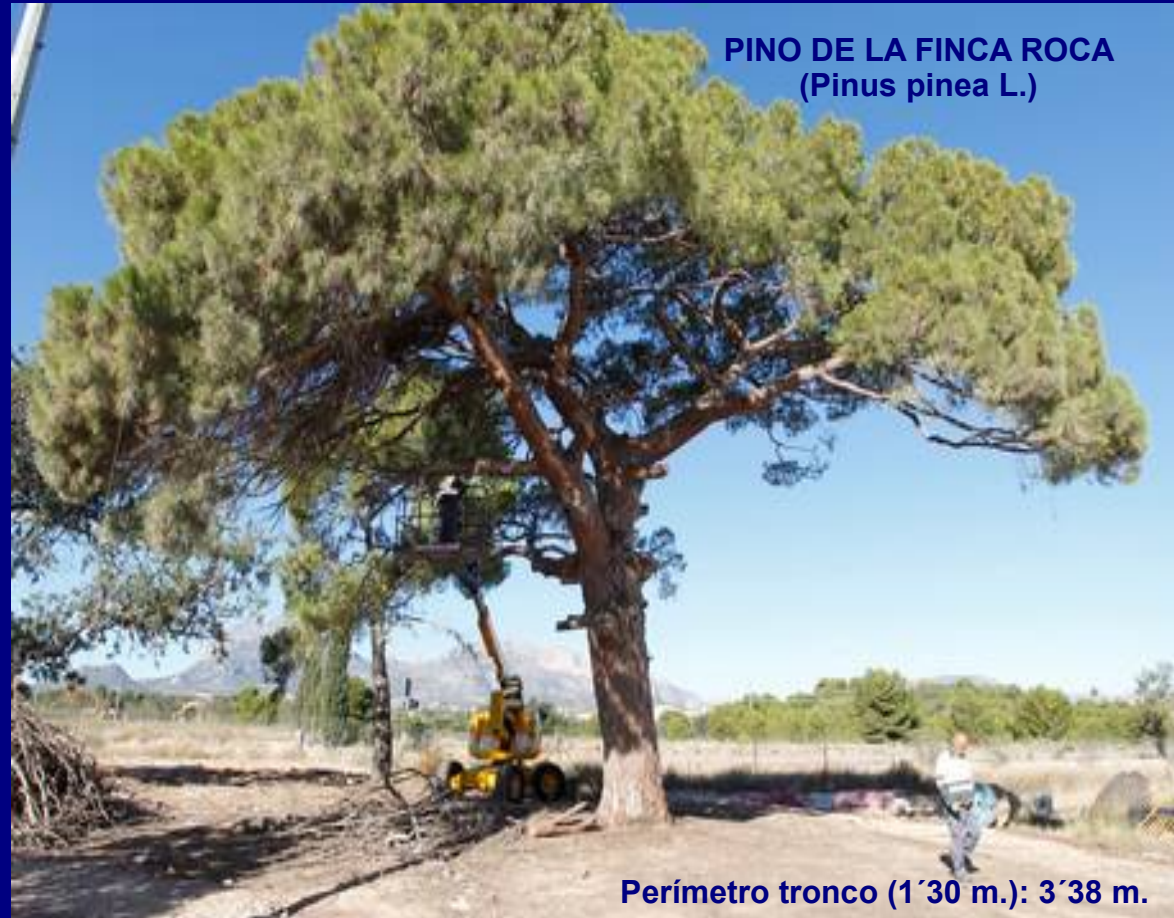
PINO DE LA FINCA ROCA (Pinus pinea L.)