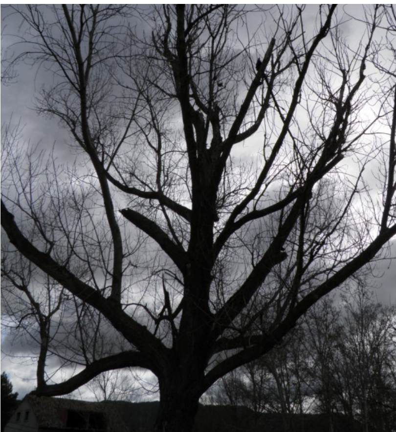
Guía y ramas principales secas.