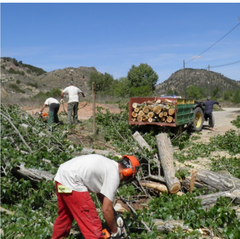
Desrame y recogida de leña.