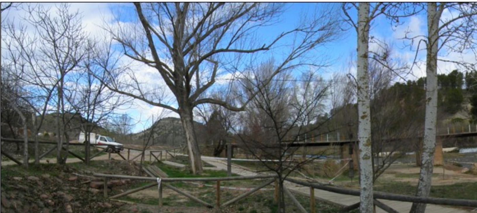
Viejo chopo y pasarela sobre el Cabriel, junto a Casas del Río.