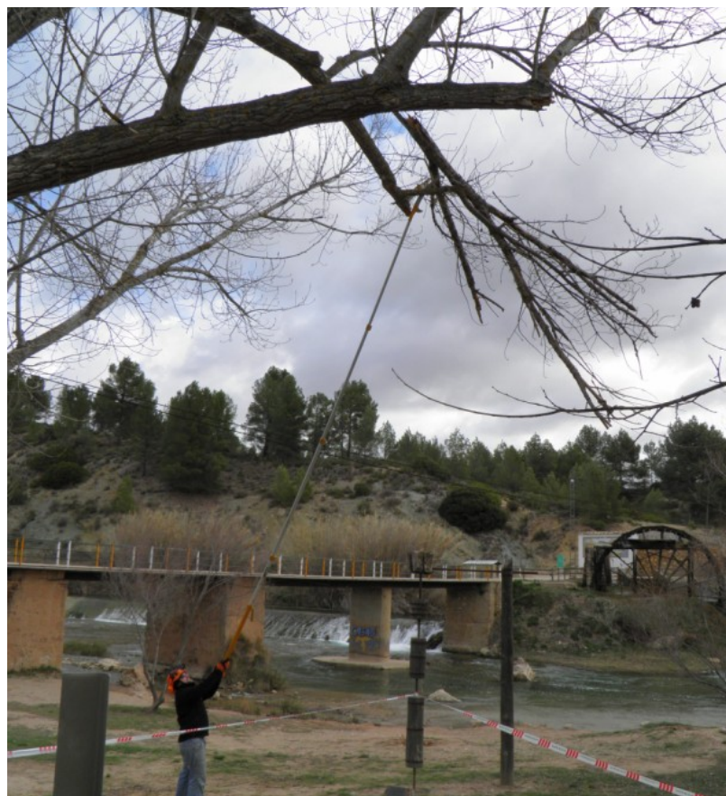
Retirada de una rama rota, pendiente de caer.