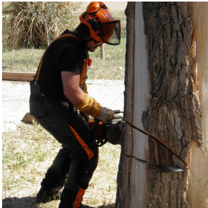
Acometiendo el derribo.