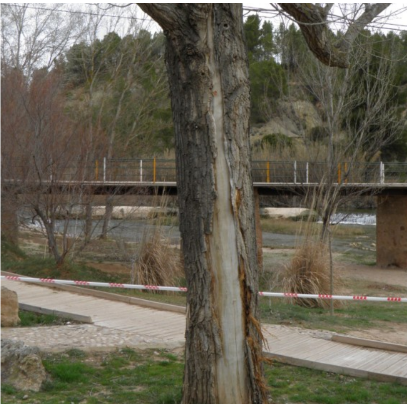
Brecha descortezada por acción de un rayo.