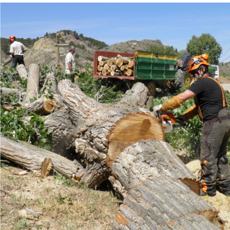
Tronzado y recogida de leña.