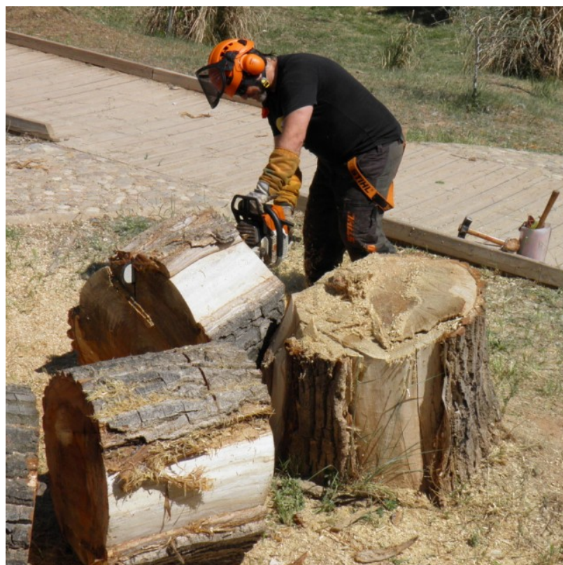
Tronzado y tocón.