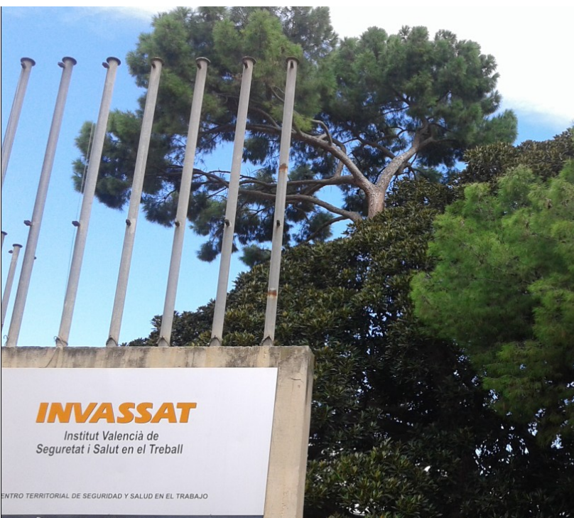
Situació de la Ficus macrophylla .