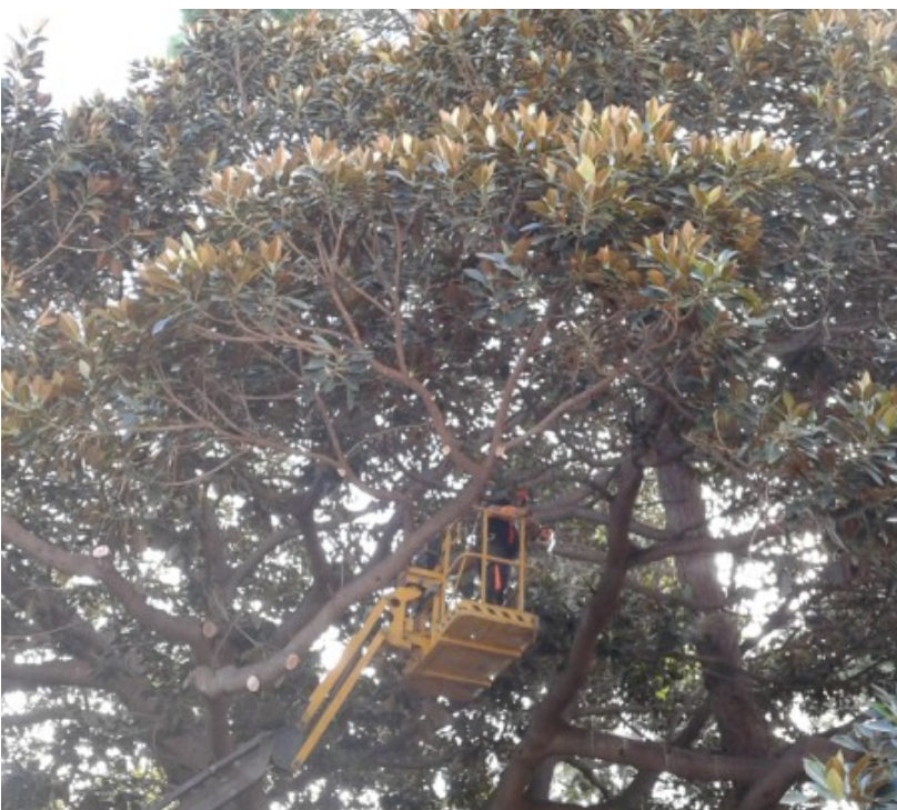
Trabajos con máquina elevadora.