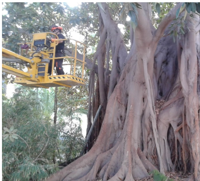
Vista del tronco.