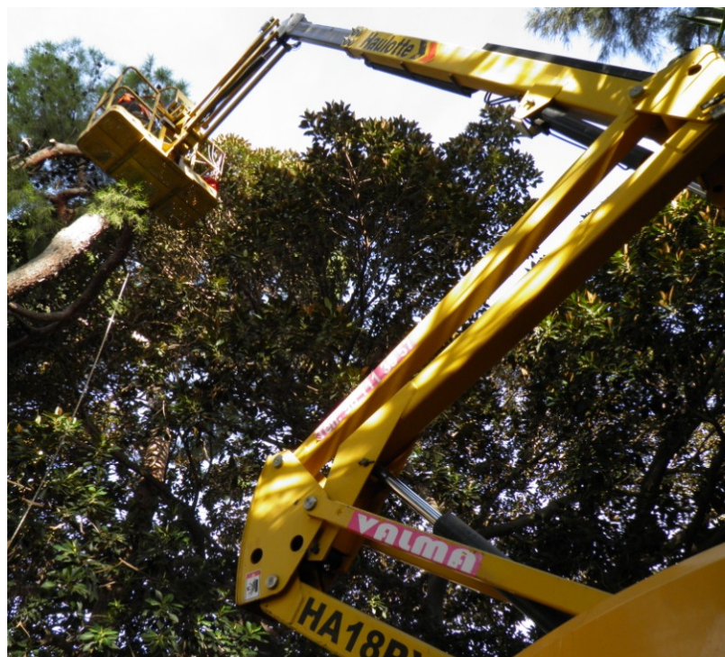
Trabajos con máquina elevadora.