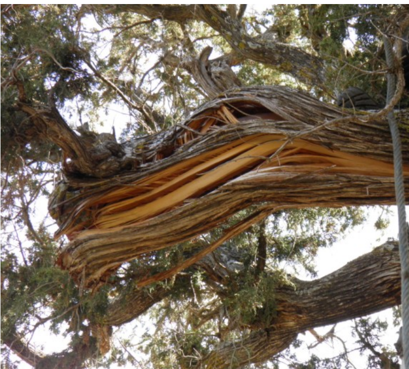
Detalle de la madera retorcida antes de sanear el corte.