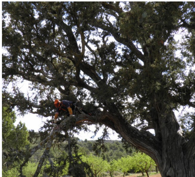
Operación de retirada de la rama tronchada.