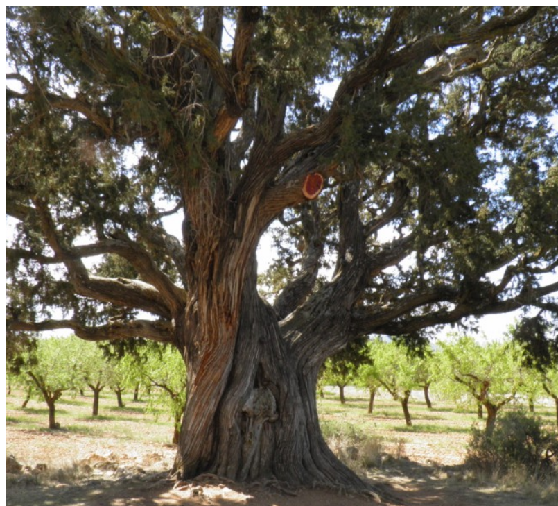
Aspecto final del árbol.