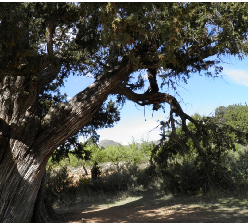
La Juana, con la rama pendiendo hasta el suelo.