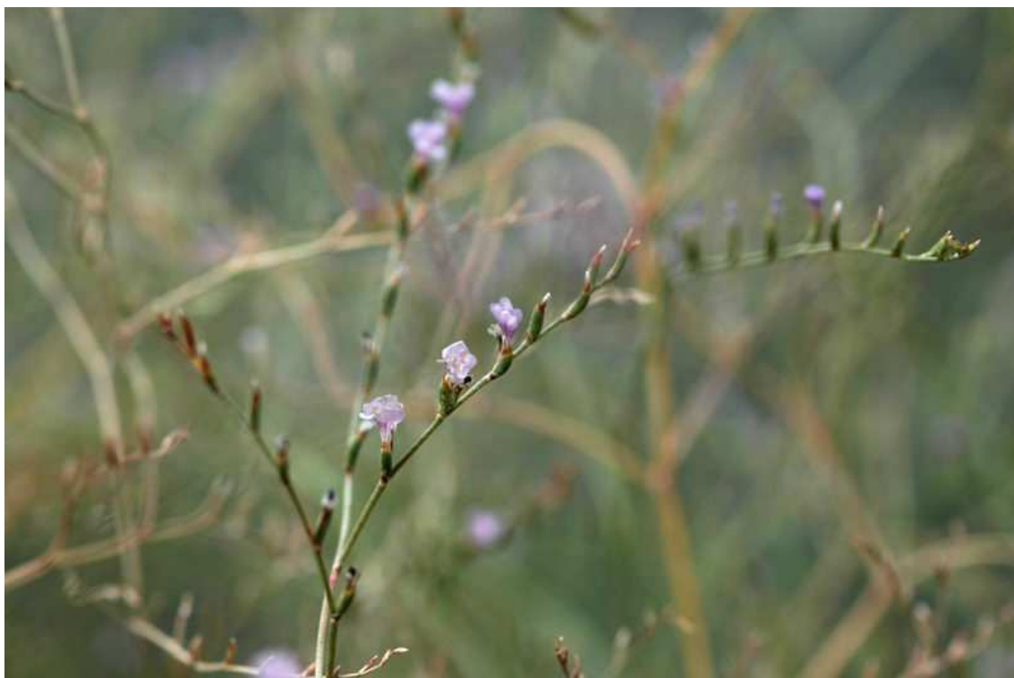
Inflorescencia de Limonium perplexum

La especie objeto del plan de recuperación es la 'Ensopeguera de Peñíscola' o 'Saladilla de Peñíscola': Limonium perplexum L. Sáez & Rosselló. Descripciones detalladas de esta especie y otros elementos sustanciales para su conocimiento figuran en: Aguilera & al. (2010), Crespo (2004) y Sáez & Rosselló (1999).