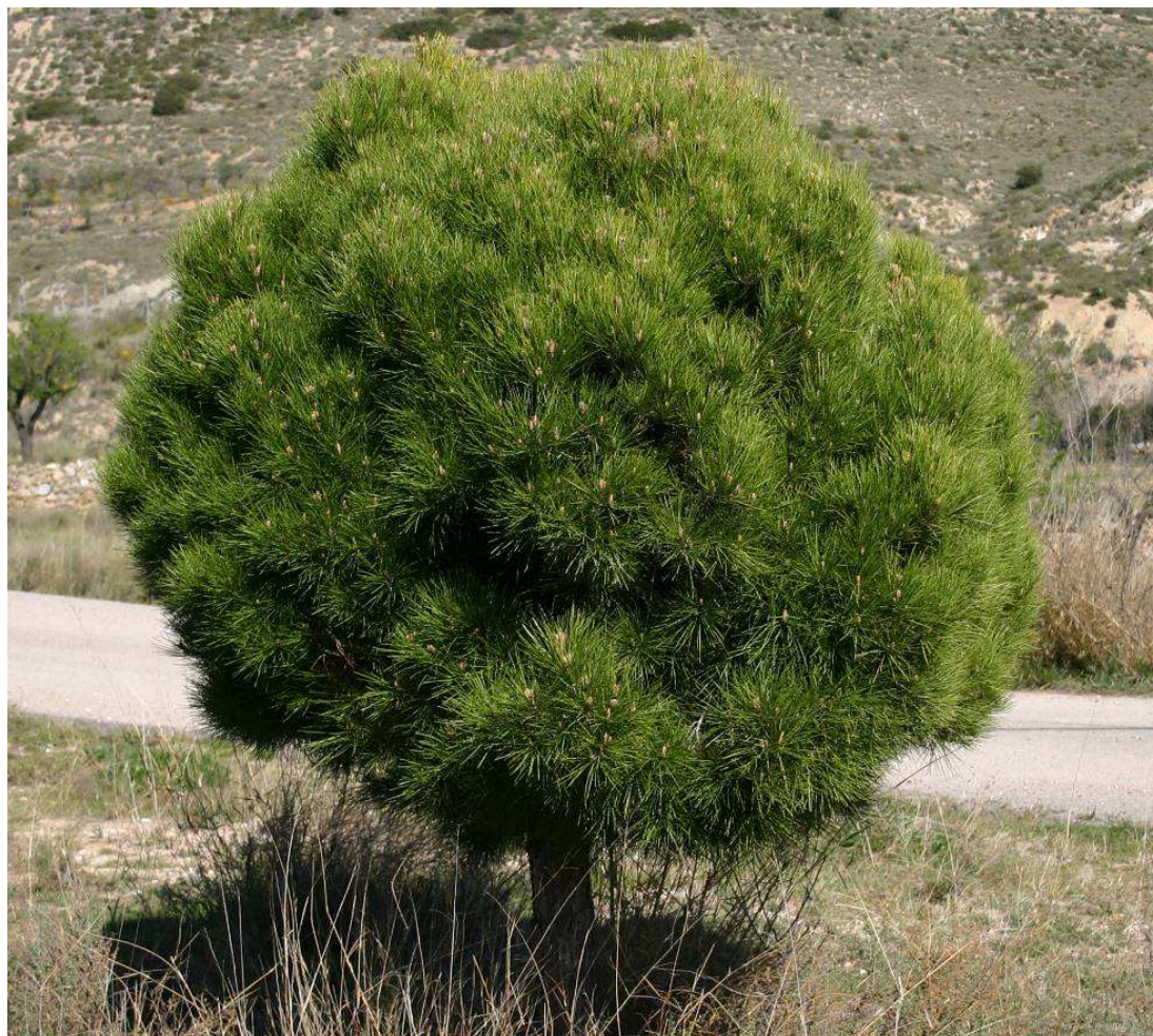
Figura 5. Ejemplar de Pinus pinea var. isodiametrica en la localidad valenciana de Chelva (Valencia).

Otras localidades: SALAMANCA: Miranda de Azán, área urbana ajardinada, 30TTL7330 , 823 m, 14-I-2006, P. Ferrer & R. Ferrer (Collect. CIEF s/n).