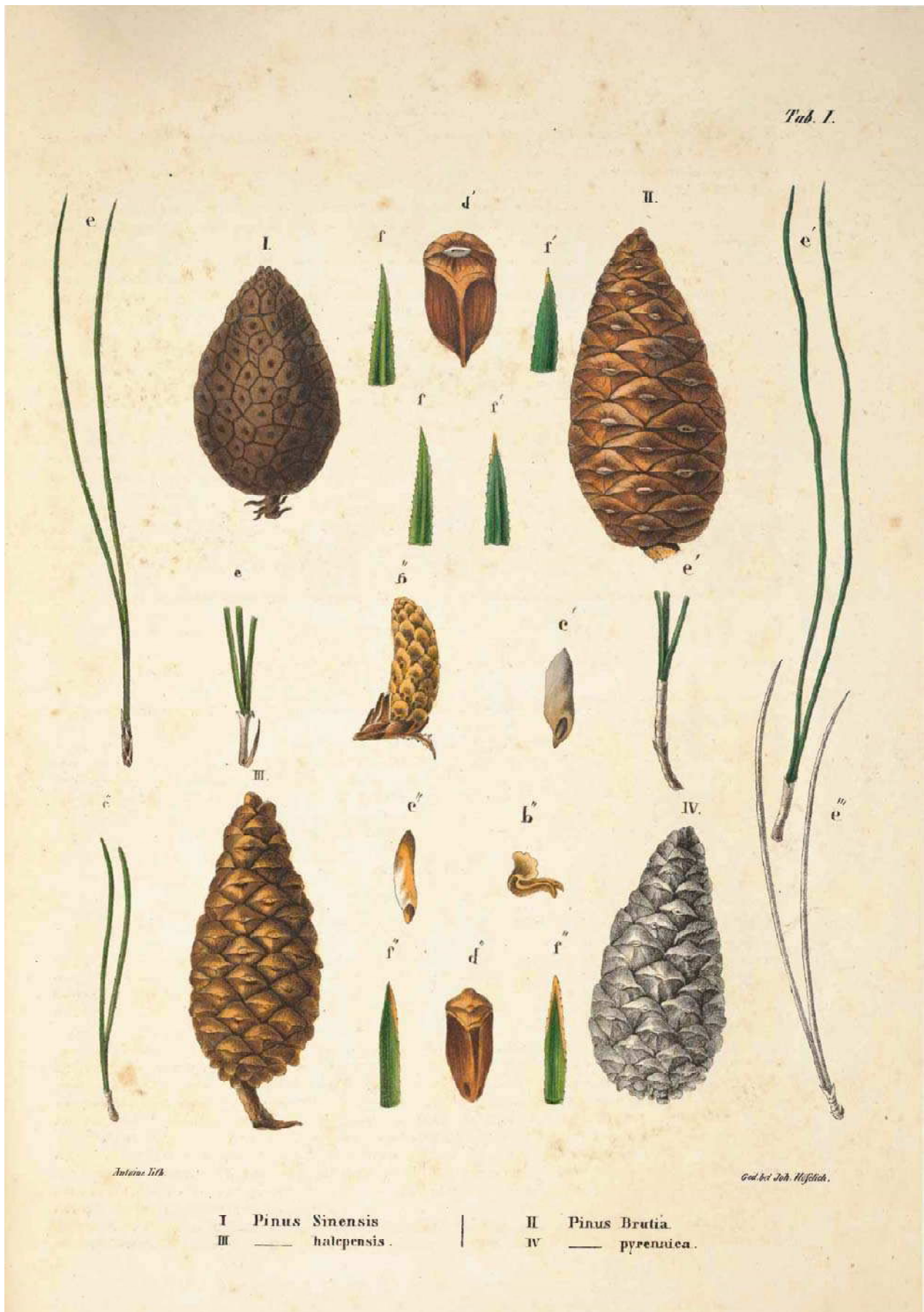
Figura 1. Pinus halepensis , de Franz Antoine, en "Die Coniferen: nach Lambert, Loudon und Anderen. Frei Bearbeitet, 1840, Tab. I. Fig. 3".