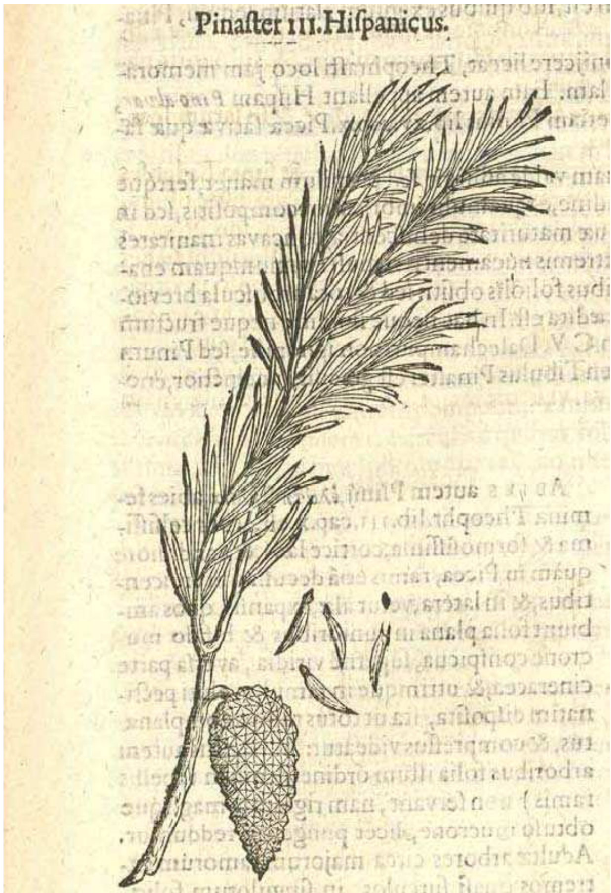
Figura 2. Neótipo de Pinus halepensis var. minor Antoine, lámina de CLUSIUS (1601: 33). Aquí designado.