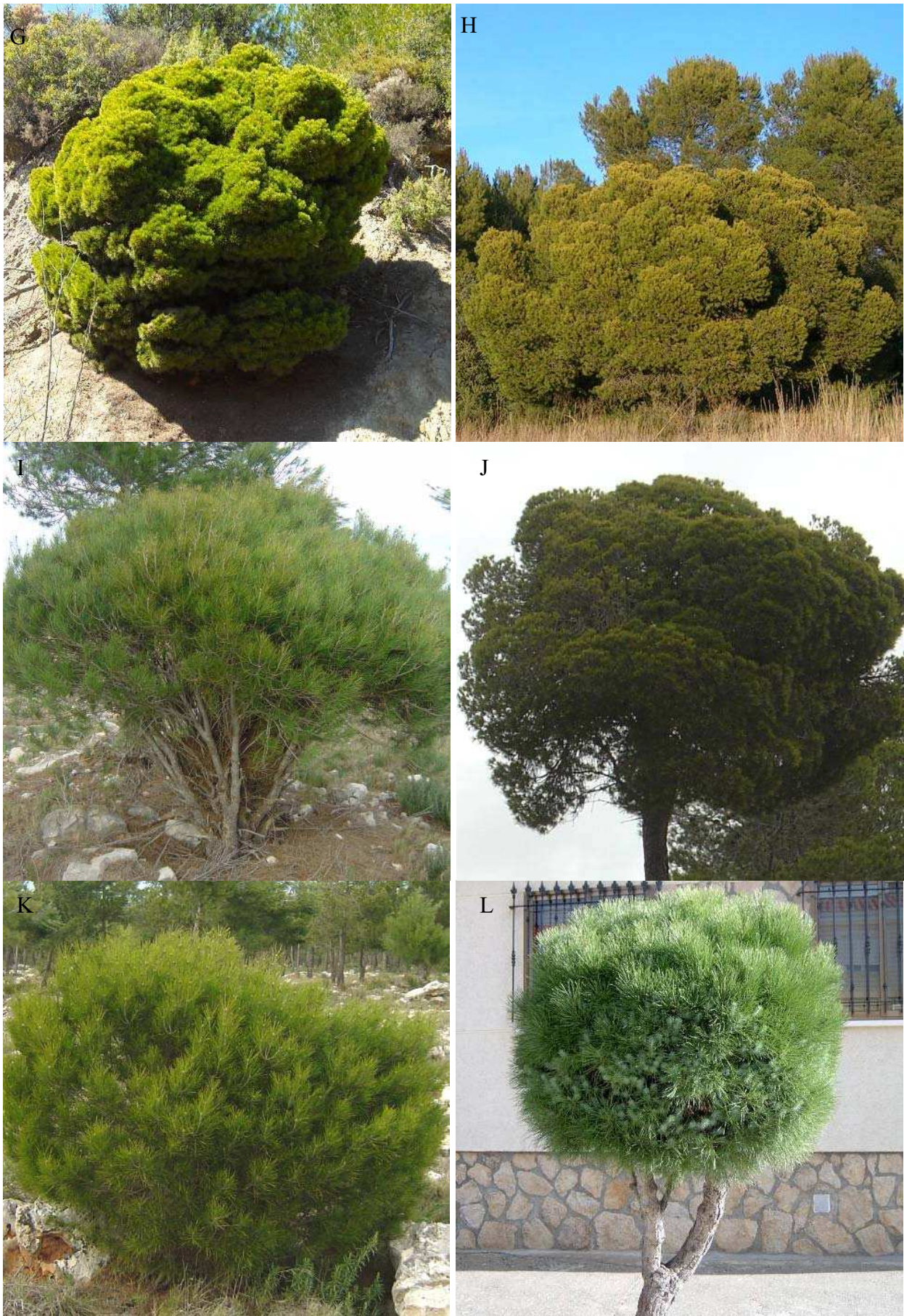
Figura 8. Ejemplares de P. halepensis var. minor G-K, y ejemplar de P. pinea var. isodiametrica en la localidad de Miranda de Azán (Salamanca) L.