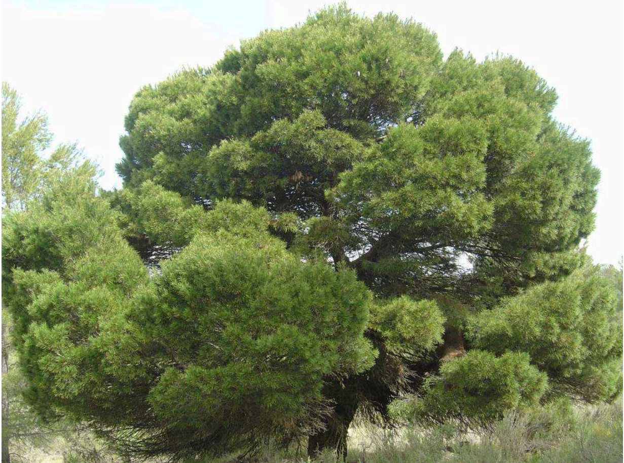
Figura 6. Ejemplares de P. halepensis var. minor en la localidad de Venta del Moro (Valencia).