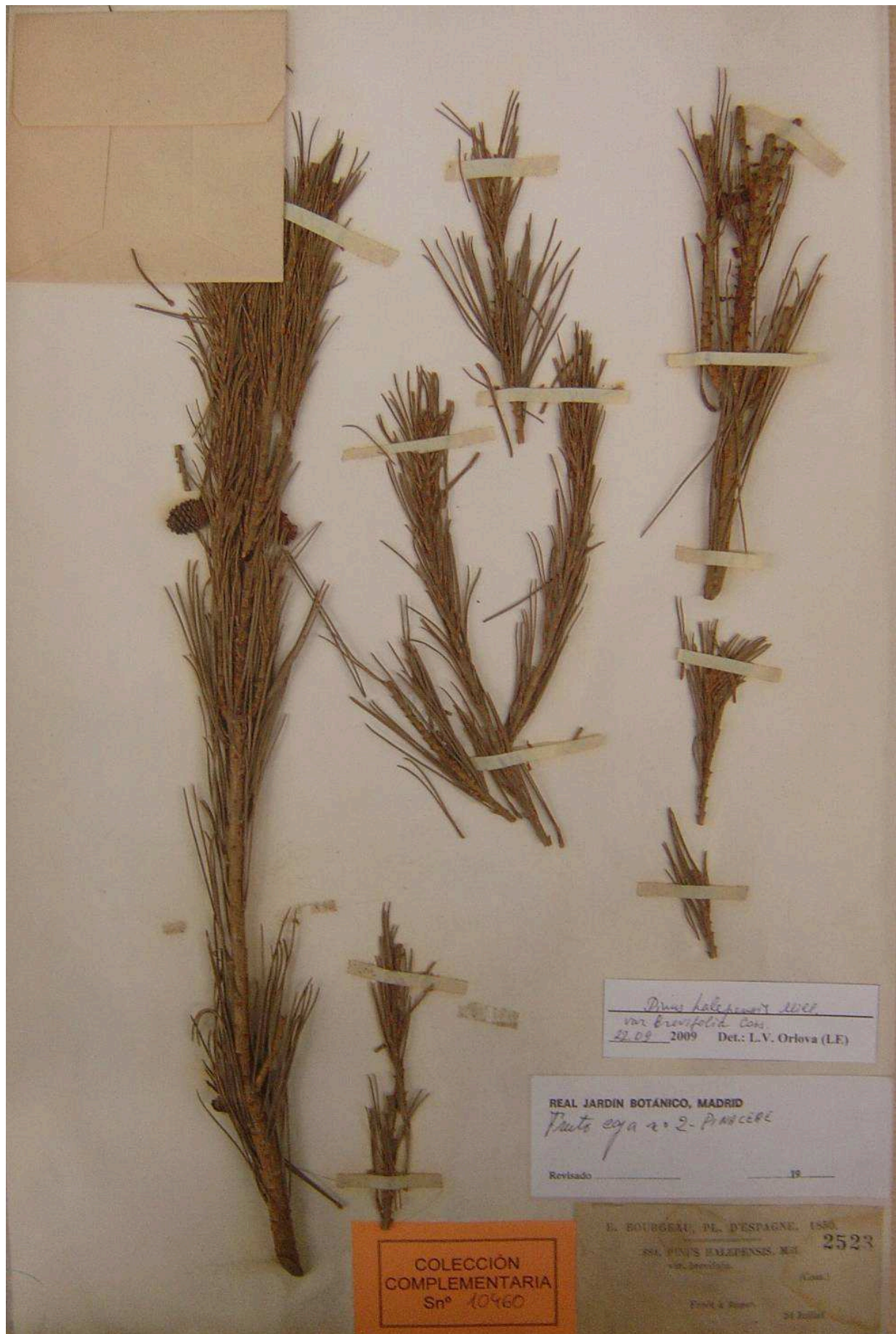
Figura 4. Pliego de Pinus halepensis var. brevifolia Coss., MA 2523.