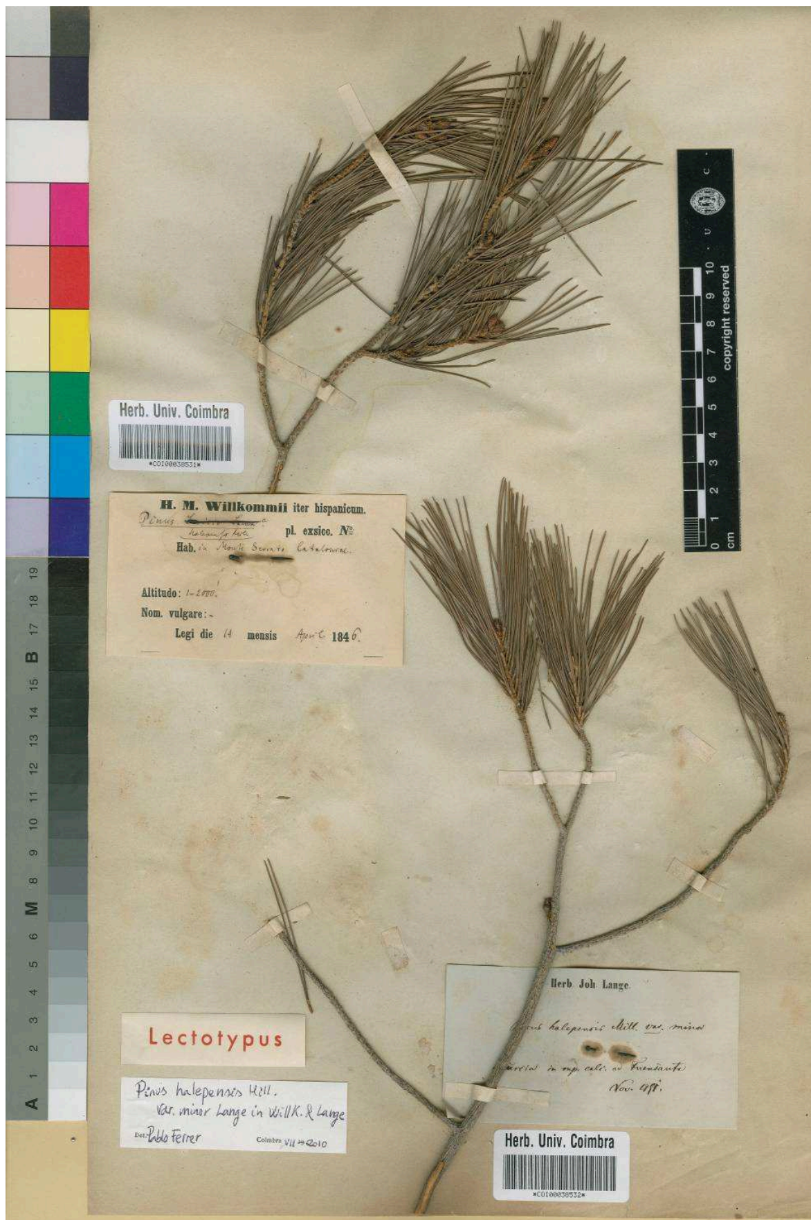
Figura 3. Lectótipo de Pinus halepensis var. minor Lange in Willkomm & Lange, COI-WILLK.