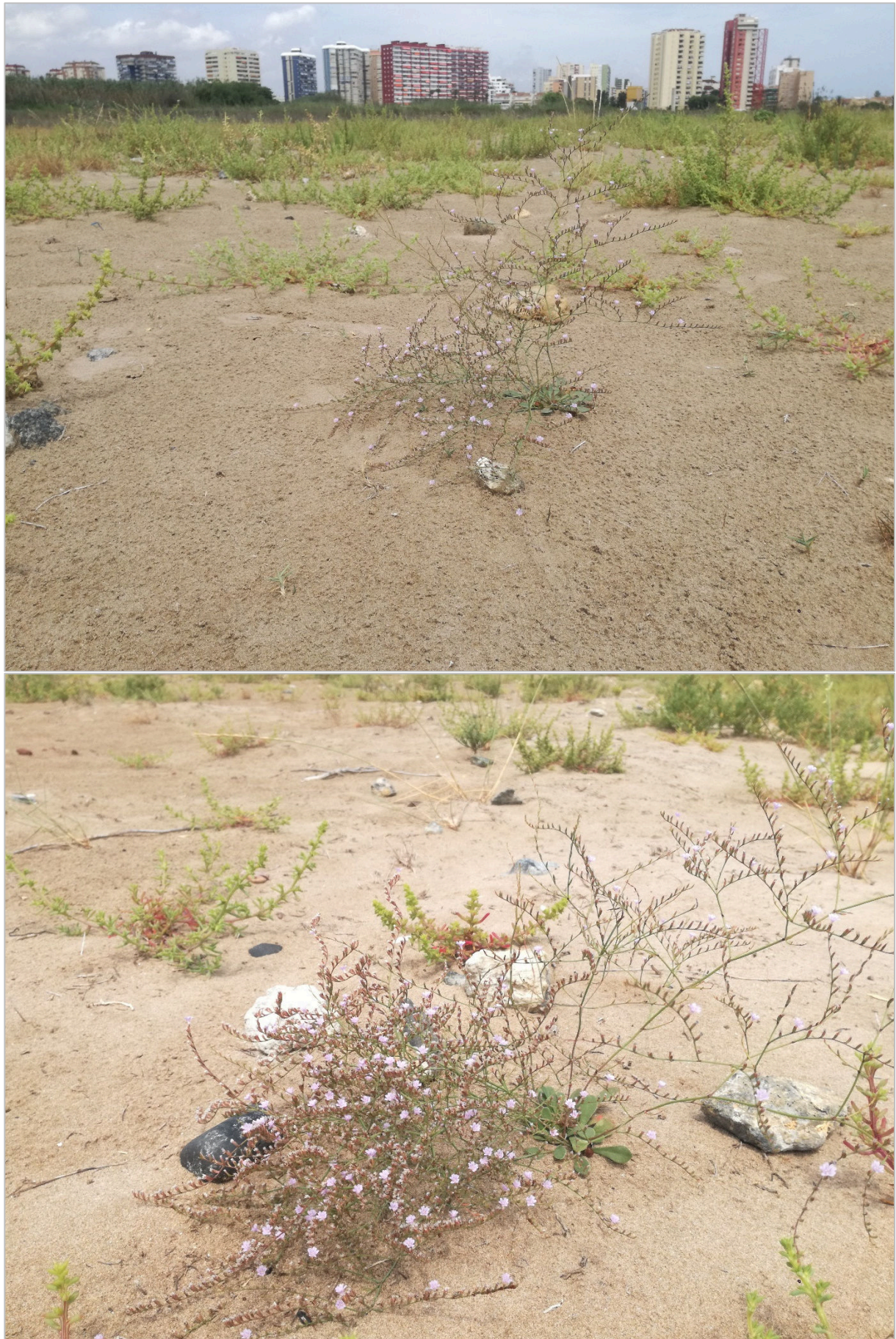
Fig. 5. Ejemplares de Limonium perplexum de la nueva población localizada en la playa de Rafalell i Vistabella (Valencia).