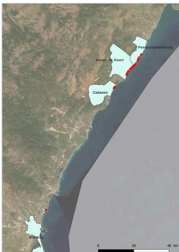
Figura 1. Situación de la nueva población localizada de Limonium perplexum en la playa Rafalell i Vistabella (Valencia) con respecto a la distribución de las poblaciones naturales y translocadas en el litoral del norte de Castellón.

El origen de esta nueva población es por el momento un enigma, aunque se barajan varias hipótesis. Por un lado, podría ser el resultado de una dispersión a mediana-larga distancia desde una población fuente situada al norte, bien desde la población original natural o una de las poblaciones translocadas a lo largo de estos años. Por otro lado, tal vez se trate de una introducción inadvertida que se haya consolidado en el lugar a través de semillas que hubieran llevado los alveolos donde se cultivaba otra especie, Silene cambessedesii Boiss. & Reut., que fue objeto de translocación en el mismo lugar en el año 2015. Por último, sin ser incompatible con las anteriores, se contempla la posibilidad de que la planta hubiera pasado desapercibida hasta el momento de su localización, y su proliferación pudiera haberse visto favorecida por las actuaciones realizadas, fundamentalmente por los ayuntamientos de Valencia y Massamagrell, en colaboración con la Dirección General de Medio Natural y de Evaluación Ambiental (Servicio de Vida Silvestre y Red Natura 2000 y Sección de Zonas Húmedas y Litorales), y la Dirección General del Agua de la Generalitat Valenciana, junto a las ONG Volunts, Seo/BirdLife y Acció Ecologista Agró, durante los últimos años para restaurar y recuperar el marjal de Rafalell i Vistabella.