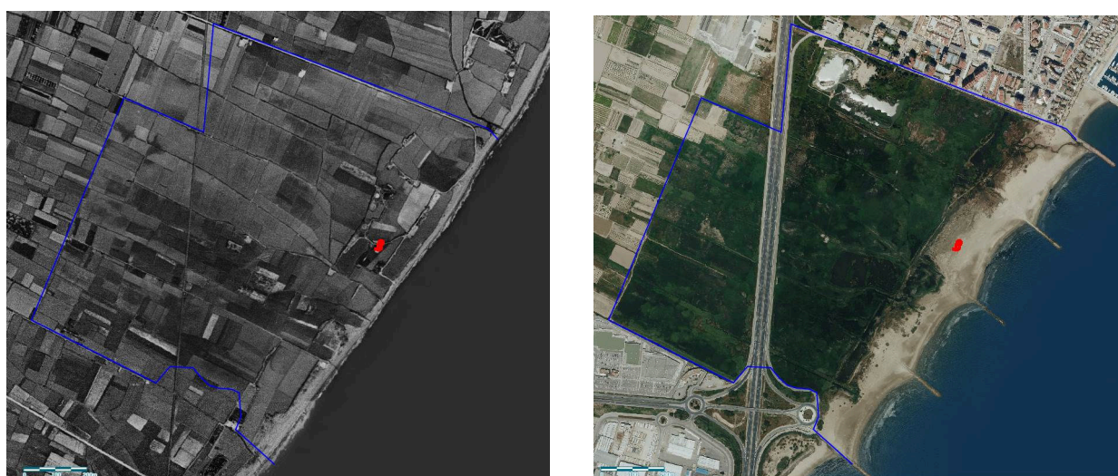
Fig. 3. Situación de la nueva población localizada de Limonium perplexum en la playa Rafalell i Vistabella (Valencia; recinto rojo). La línea azul muestra la delimitación de la zona húmeda catalogada sobre la ortofoto de 1956 (vuelo americano; izquierda) y la ortofoto más actualizada (2022, derecha). Se puede apreciar que prácticamente toda la zona húmeda actual se encontraba cultivada en los años 50.