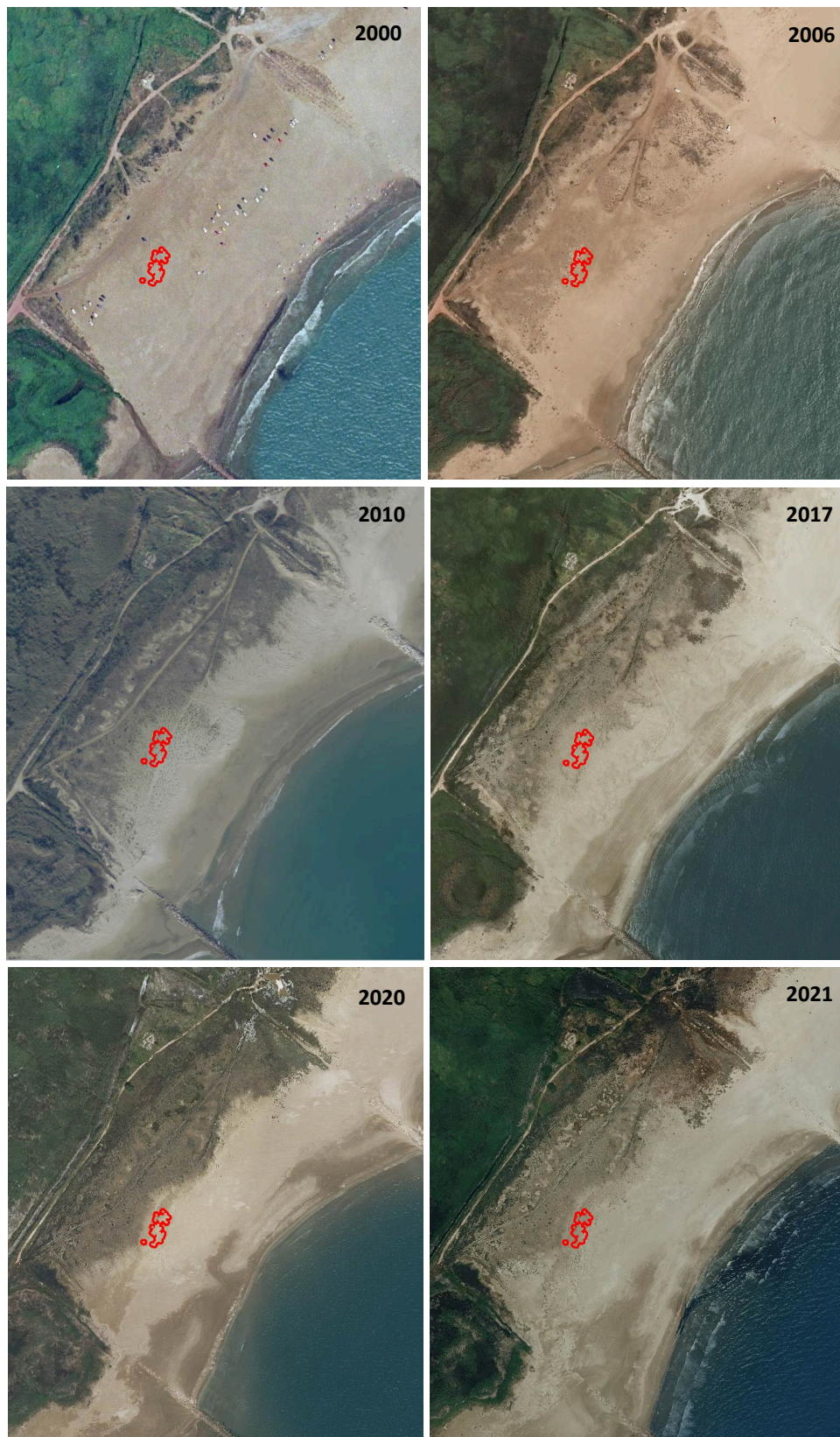
Fig. 2. Situación de la nueva población localizada de Limonium perplexum en la playa Rafalell i Vistabella (Valencia) con respecto a las ortofotos históricas para el periodo 2000-2021.