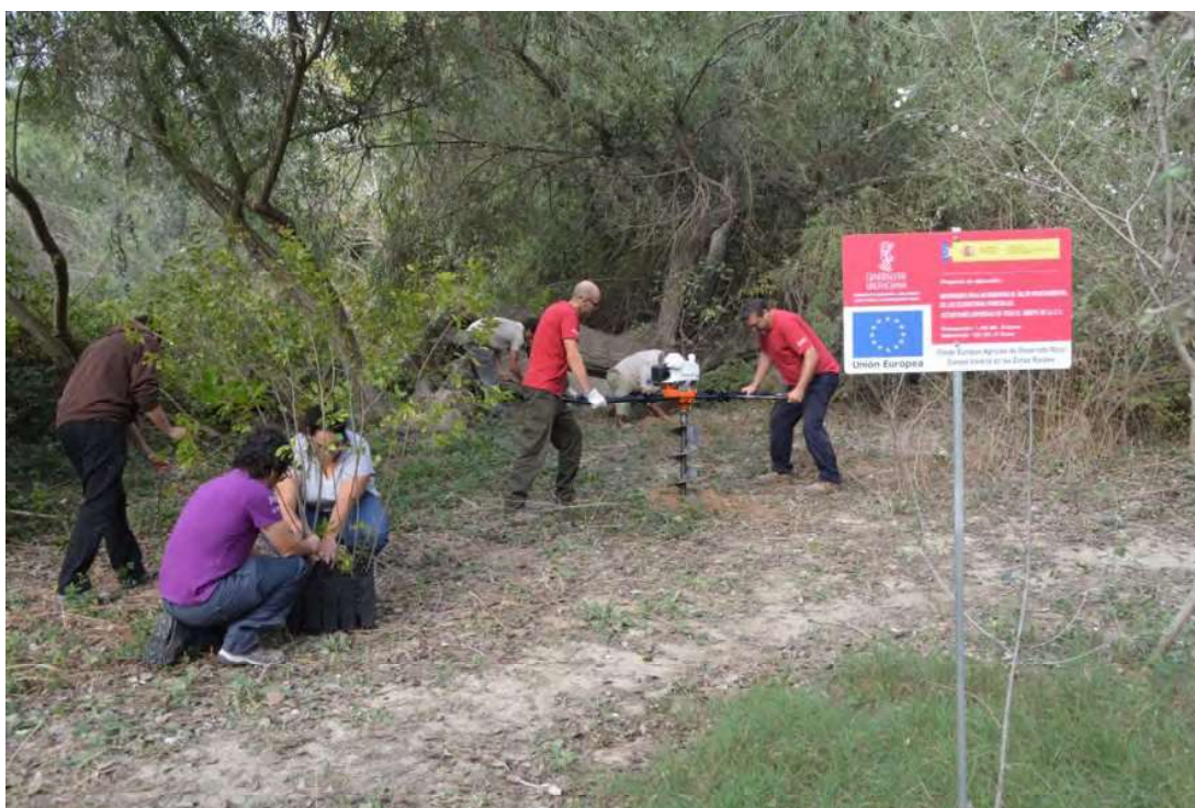
Figura 5. Trabajos de plantación en campo y participación social.