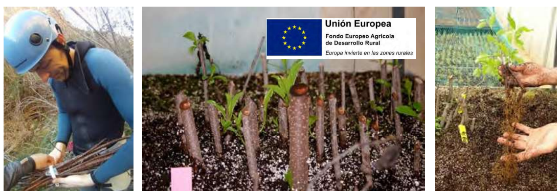
Figura 2. Recolección de material vegetal de reproducción, estacas en mesa de cultivo y fase de enraizamiento.