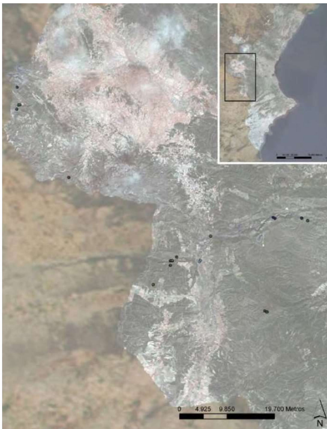
Figura 4. Localización de algunas de las plantaciones realizadas dentro de la provincia de Valencia.