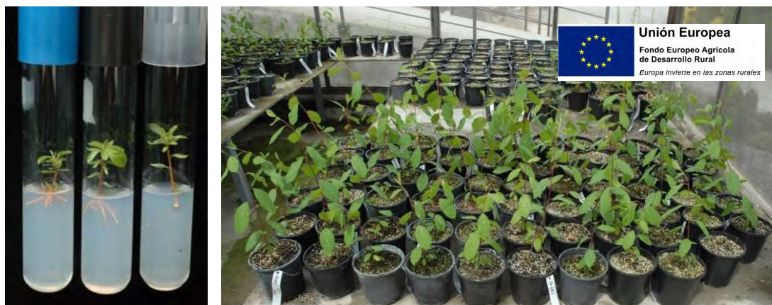
Figura 1. Multiplicación in vitro y fase de aclimatación y enraizamiento de las plantas bajo condiciones de invernadero.