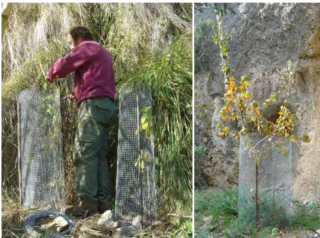
Figura 6. Colocación de protectores de hierro en ejemplares introducidos de Frangula alnus subsp. baetica en la población valenciana de Casa de los Baños (Jalance, Valencia).