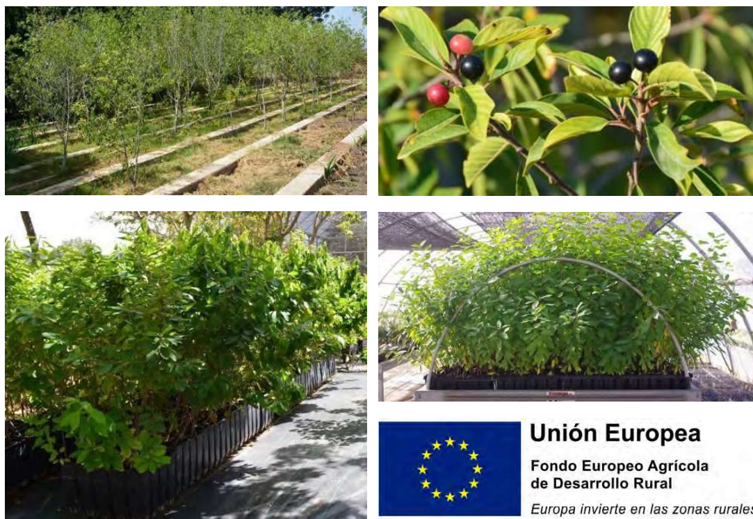
Figura 3. Colección de planta viva mantenida ex situ en el CIEF y producción de planta a partir de la semilla generada por la colección.