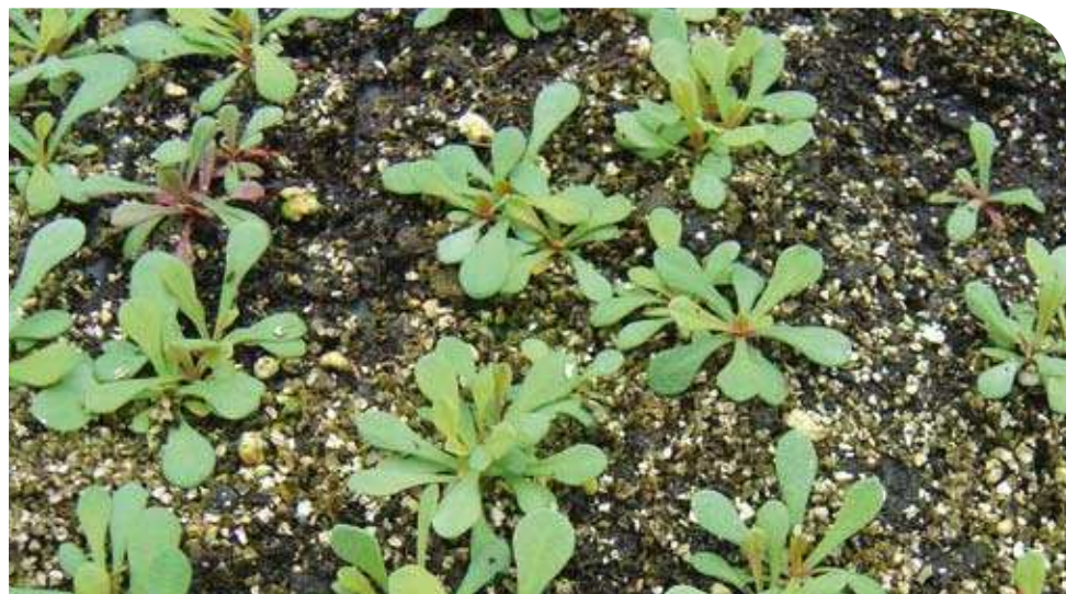
Producción de planta de L. mansanetianum .

La primera actuación se ha llevado a cabo en la localidad de Las Salinas, en el término municipal de Manuel, una de las poblaciones donde un alto porcentaje de individuos desapareció recientemente debido a movimientos de tierra que sepultaron gran parte de la población. En este lugar, se introdujeron dentro de un hábitat propio de Gypsophiletalia un total de 558 ejemplares en un área de 198 m 2 , quedando así la población aumentada en un 15,7 % respecto de su área de ocupación en este núcleo y en un 7,7 % respecto del tamaño poblacional total.