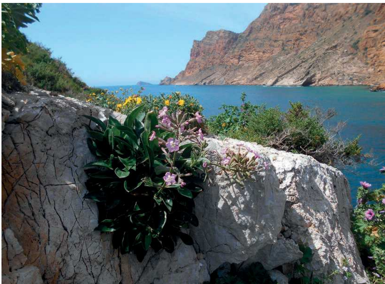
Silene hifacensis , en población de la Illa Mitjana procedente de la siembras realizadas.

Servicio de Vida Silvestre – Servicio de Gestión de Espacios Naturales Protegidos Dirección General de Medio Natural y Evaluación ambiental – Generalitat Valenciana