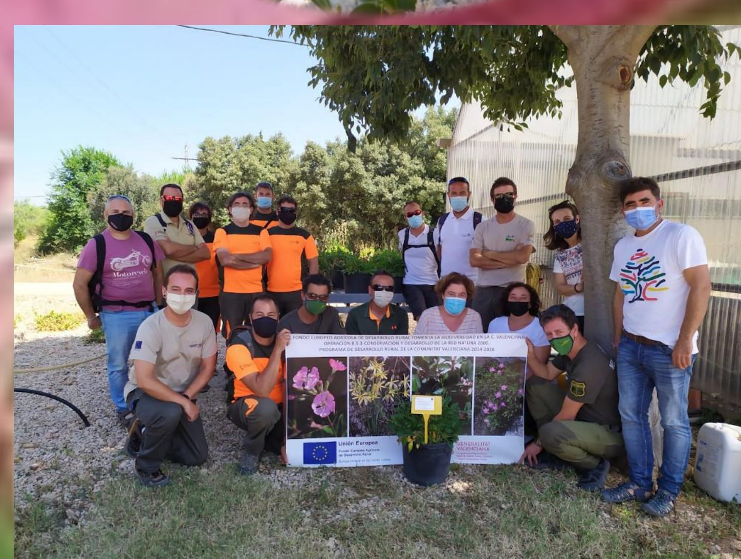
Parte del Grupo de Trabajo del Plan de Recuperación de Silene hifacensis en la Comunidad Valenciana en la V Reunión de coordinación realizada en junio de 2021

Un total de 54 poblaciones han sido creadas desde el año 2011 Las poblaciones están repartidas en 24 cuadrículas de 1 km de lado. En mayo de 2021 el censo total es de 1166 plantas procedentes de los trabajos de translocación, a las que hay que sumar 15 ejemplares naturales. De todas estas plantas, 756 son consideradas adultas-reproductoras. Estos indicadores permiten inferir que se alcanzará el objetivo global marcado en el Plan de recuperación en 2022, momento en el cual se podrá solicitar al Ministerio para la Transición Ecológica y el Reto Demográfico el cambio de categoría nacional para la península de "En peligro de extinción" a "Vulnerable", y posteriormente hacer el cambio similar en la legislación valenciana.