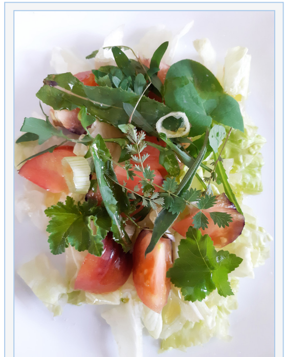
FIGURA 1. Ensalada campestre amb base de lletuga i tomata, amanida amb diverses espècies silvestres: Sonchus asper , Lavatera arborea , Sanguisorba minor , Allium ampeloprasum , Plantago lanceolata i Silene vulgaris .

'Les nostres plantes' (Climent, 1985) o el 'Costumari Botànic' (Pellicer, 2001-2004) ens permet trobar bona part d'aquesta ampla composició vegetal, que en molts casos pogué ser el resultat d'un procés multiseular de selecció en què es van evitar les espècies tòxiques, però on se'n van incloure d'altres de sabors forts - picants, amargs, àcids - que contrastaven amb la resta de components del plat. En eixe procés selectiu també podria haver tingut rellevància el valor natracèutic de les seues espècies integrants, és a dir, les que funcionen com a aliments i que simultàniament posseeixen propietats curatives (v. Peris et al., 1995, 2001; Stübing & Peris, 1998; Rivera et al., 2005, 2006, 2008; Leonti, 2012; García-Herrera, 2014; Molina et al., 2014; Alarcón et al., 2015; Bernabeu-Mestre et al., 2015; Laguna et al., 2017). De fet, moltes de les espècies indicades en texts populars sobre fitoteràpia com ara els de Messegué (1973) o Juan (1883), són plantes silvestres comestibles que han estat emprades en les ensalades campestres,