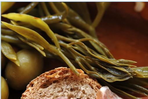
FIGURA 6. Fulles de fenoll marí ( Crithmum maritimum ) assaonades en aigua-sal, servides per a menjar.

♦ Scandix sp. (agulles de pastor, peine de Venus ): es tracta de plantes anuals prou freqüents en herbassars de pistes rurals i terrenys agrícoles, així com en pasturatges naturals. Tot i que l'espècie més citada per al consum és Scandix pecten-veneris L., és més que probable que s'hagen inclòs altres espècies valencianes que es diuen d'igual manera. El seu consum requereix cuinar-les prèviament, i usar els brots de la planta encara no fructificada.