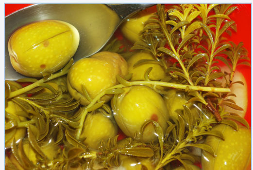
FIGURA 11. Olives ( Olea europaea ) i tiges de raïm de pastor ( Sedum sediforme ) en aigua-sal, adobades amb sajolida ( Satureja intricata subsp. gracilis ). Figura: E. Laguna.

Caper plant ( Capparis spinosa ) with flower pumps, of which the capers are made. Photo: E. Laguna.