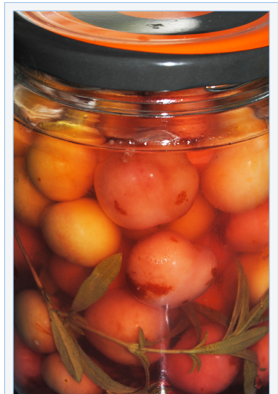
FIGURA 16. Cireres de cirerer bord ( Prunus avium ) adobades en aigua-sal, amb sajolida o herba d'olives ( Satureja intricata subsp. gracilis ). Foto: E. Laguna.

* Família Vitaceae. Del raïm s'extrau el vinagre, component essencial - junt amb l'oli - de les ensalades. Però en aquest apartat volem referir-nos particularment a les formes silvestres i cultivades de les vinyes. Les puntes de les tiges verdes dels ceps de Vitis vinifera L. (vinya, vid ) sovint assilvestrada a les zones properes on es cultiva, és allò que es menja cru o assaonat en ensalada (Hoya de Buñol, Plana de Requena-Utiel). S'usen les tiges tendres de fins a mig centímetre de gruix, convenientment adobades en aigua-sal i més endavant pelades i fetes a trossets, que proporcionen al