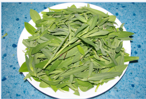
FIGURA 2. Fulles de colitxes, fardolets o conillets ( Silene vulgaris ), una de les verdures més apreciades per afegir en fresc a les ensalades.

Les ensalades camperestres no s'han extingit del tot al territori valencià, sinó que segueixen consumint-se esporàdicament en l'àmbit rural, sobretot la gent d'edat més avançada, que hi troba un altre element d'autoidentificació, en reconèixer sovint sabors i matisos culinaris que els fan recordar la seua joventut o infantesa. L'abandó que ha patit l'ús i recol·lecció de les verdures silvestres, podria contrarestar-se si tenim en compte els interessants elements de desenvolupament sostenible que poden representar en algunes àrees rurals valencianes, donat que el seu ús permet la reconstrucció d'una peculiar gastronomia -diriem endèmica, emprant un terme netament botànic- que, convenientment adaptada, podria esdevindre un element afegit de reclam ecoturístic i d'autoreconeixement de la societat rural. Cal destacar addicionalment el seu valor natracèutic, ja citat més amunt, a part de l'avantatge que suposa l'ampliació de l'espectre de sabors i l'absència d'elements químics adversos, més bé