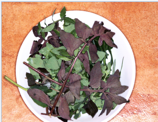
FIGURA 3. Collita de fulles de llicsons, Sonchus tenerrimus , amb diferents colors. Figura: E. Laguna.

♦ Calendula officinalis L. (boixac, pet de frare, caléndula , maravilla ): les seues flors de color taronja s'incorporen com un atractiu visual a les ensalades, a les quals aporten una acció colerètica i estimulants