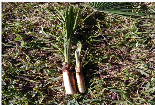
FIGURA 9. Medul·la o 'cor' del margalló ( Chamaerops humilis ), abans de llevar-li les fibres externes.

♦ Asparagus horridus L. (esparreguera amarga, espàrrago amargos ): és una esparreguera freqüent en orles de llentiscars, coscollars i matollars secs de les comarques litorals. També se la veu créixer entre les pedres dels murs dels cultius de secà. Les puntes dels turions, encara que un punt més amargs que els de l'espècie que ve a continuació, es mengen crus en ensalada, a les quals aporten fibra i propietats diürètiques.