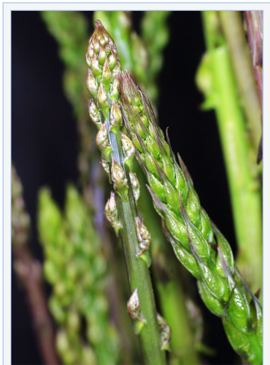
FIGURA 13. Espàrrecs d'esparreguera vera o comuna ( Asparagus acutifolius , a l'esquerra) i de gatmimo ( Tamus communis , a la dreta).

* Família Plantaginaceae. S'usen les fulles en ensalada de diverses espècies del gènere Plantago L., riques en vitamines A, C i calci, així com en mucíl·lags que ajuden al trànsit intestinal.