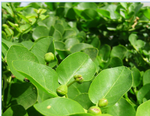
FIGURA 10. Tapenera ( Capparis spinosa ) amb els puncells florals, dels quals es fan les tàperes.

* Família Dioscoreaceae. Representada en la flora valenciana per Tamus communis L. (gatmaimó, nueza negra, truca ), espècie pròpia d'hàbitats forestals i preforestals de les comarques més plujoses de baixa altitud. Se'n consumeixen els brots de les noves tiges (esparraguets, esparraguillas ), cuits, amb un sabor amarg que recorda el dels brots del galzeran ( Ruscus sp.). La resta dels òrgans de la planta són verinosos pel seu contingut en saponòsids esteroidals, derivats de la