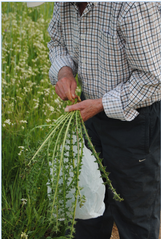
FIGURA 5. Recollida en el camp de cardets de moro, Scolymus hispanicus .

♦ Bunium sp. pl. (castanyoles, surollons, castañas de tierra , macucas ): plantes d'hàbits forestals que també es troben als marges dels cultius propers, representades per les espècies B. balearicum (Sennen) Mateo & López-Udías i B. macuca Boiss. S'usen els seus tubercles subterranis, moltes vegades situats a molta profunditat; es consumeixen crus, pelats i trossejats o preparats a talladetes, pel seu contingut en fècula, de sabor