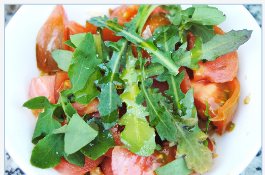
FIGURA 4. Ensalada o 'picadeta' de tomata amb fulles de cosconella ( Reichardia picroides ) i llicsó o lletsó ( Sonchus tenerrimus ).

Harvested leaves of Slender Sow-thistle, Sonchus tenerrimus , with several colours.