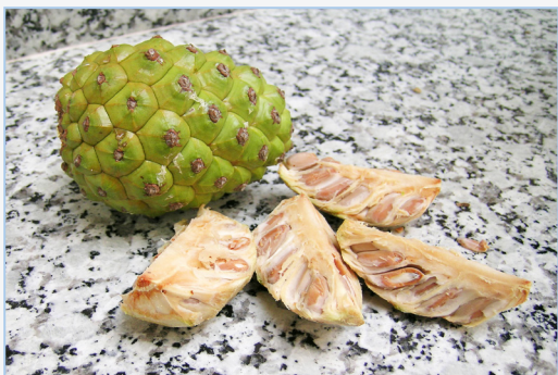
FIGURA 15. Gallons de pinya de pi pinyoner ( Pinus pinea ) ja amanits per a adobar-los en aigua-sal.

* Família Ulmaceae. Grans arbres forestals del