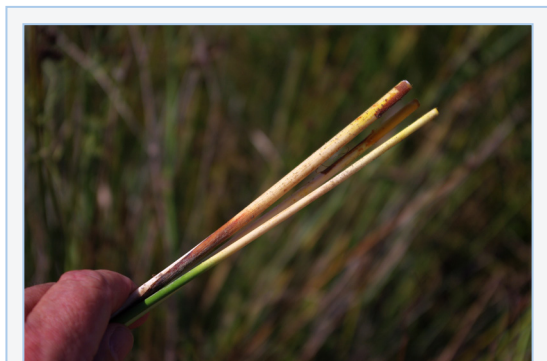
FIGURA 12. Collita de la base de les tiges del jonc boval ( Scirpus holoschoenus ), mostrant la part blanca comestible.

Els brots florals i les flors joves d'aquesta espècie, així com les de Lavatera cretica L. (formatgets, malva loca ), L. maritima Gouan (malvera blanca, malva blanca ), i de L. arborea (malvió, malva arborea ), es fiquen en les ensalades pel seu sabor suau, per les propietats