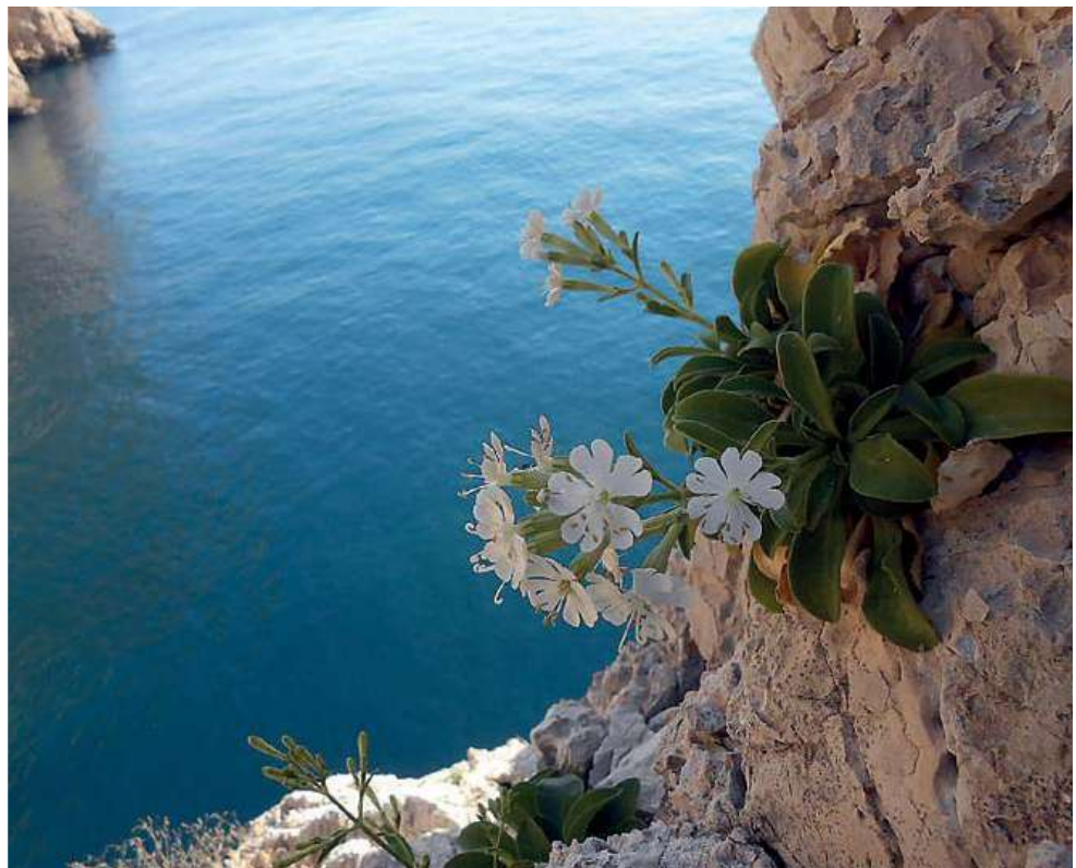
A la izquierda: trabajos verticales de siembra en Cova de les Cendres. Sobre estas líneas: ejemplar de flor blanca introducida en el Illot de la Mona