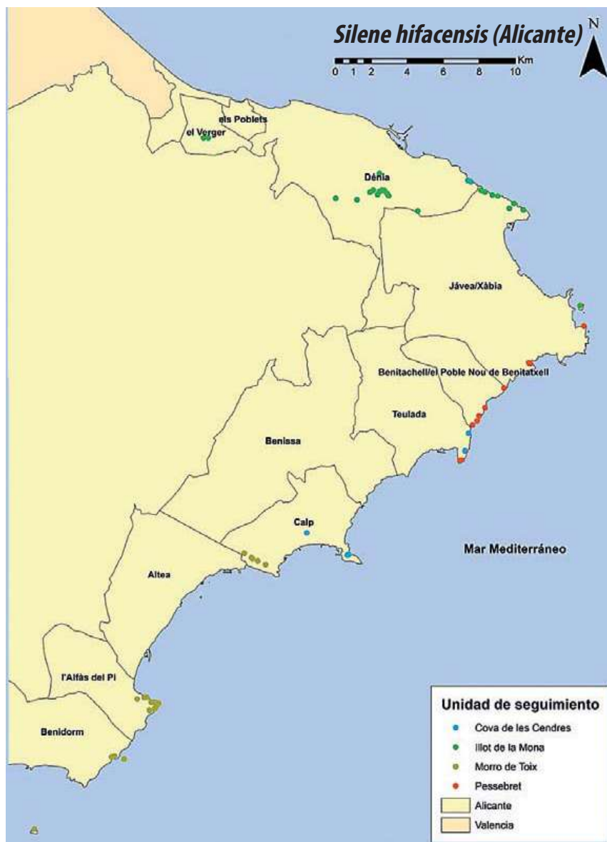
Fig. 2. Mapa de distribución de las poblaciones creadas desde la año 2009 hasta la actualidad en la Comunidad Valenciana.

Los valores alcanzados en estos indicadores y su tendencia permiten inferir que se alcanzará el próximo año los objetivos marcados en el Plan de recuperación de esta especie en la Comunidad Valenciana, momento en el cual se podrá solicitar al Ministerio para la Transición Ecológica y el Reto Demográfico el cambio de categoría nacional para la península de "En peligro de extinción" a "Vulnerable", y posteriormente hacer el cambio similar en la legislación valenciana.