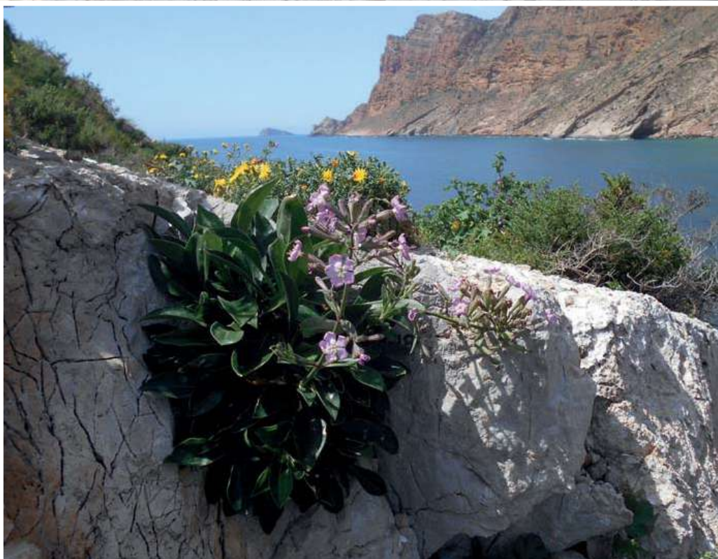
Arriba: ejemplar introducido de flor blanca en el Illot de la Mona. Abajo, a la izquierda: Silene hifacensis introducida en Ila Mitjana. A la derecha: trabajos verticales de siembra de Silene en el Peñon de Ifac