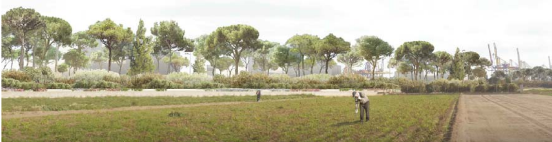
Tratamiento de borde de la ZAL con la Huerta. Infografía de la propuesta (elaborada por EMAC)