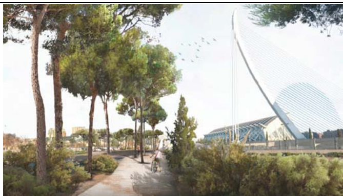
Punto inicial del corredor verde a la altura del puente l'Assut de l'Or. A la izquierda estado actual. A la derecha infografía del estado final una vez implementado la propuesta (Elaborada por EMAC)