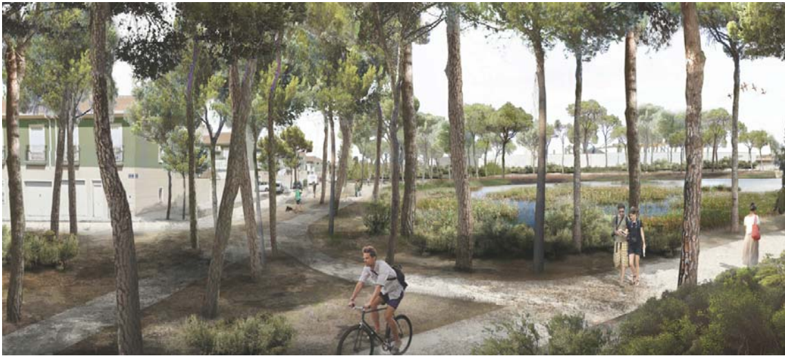
Conexión del nuevo tramo de carril bici con el parque de Nazaret y el CR-500. Arriba estado actual, infografía de la propuesta (elaborada por EMAC)