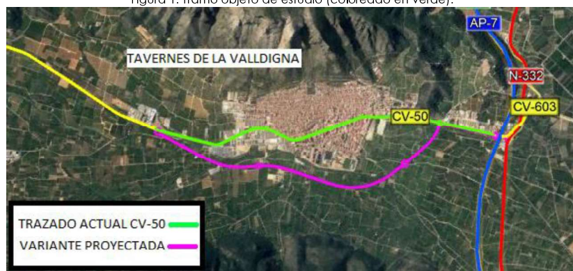
Figura 1. Tramo objeto de estudio (coloreado en verde).

A su paso por Tavernes de la Valldigna, la CV-50 discurre en travesía por el interior del casco urbano del municipio, en concreto por la Gran Vía Germanías y la avenida de la Valldigna. En esta zona la carretera presenta calzada única de dos carriles (un carril por sentido), dispone de aceras de ancho variable y está bordeada zonas de aparcamiento en ambos lados (mayoritariamente en batería). La travesía presenta numerosos cruces con viario adyacente, algunos de los cuales se encuentran semaforizados, mientras que otros están resueltos con glorietas y el resto son accesos directos en los que las incorporaciones a la CV-50 se regulan mediante señales de STOP. En la siguiente figura se observa coloreado en verde el tramo actual objeto de estudio.