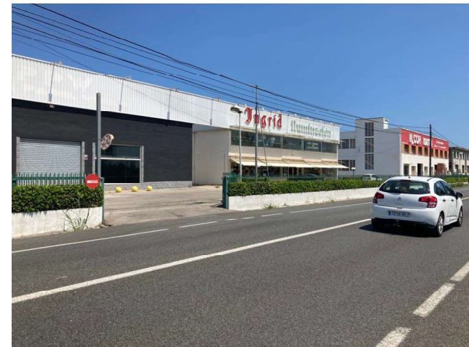
Figura 5. Accesos a las fábricas del polígono industrial reducidos, con poco espacio de maniobra para acceder a la CV-50.