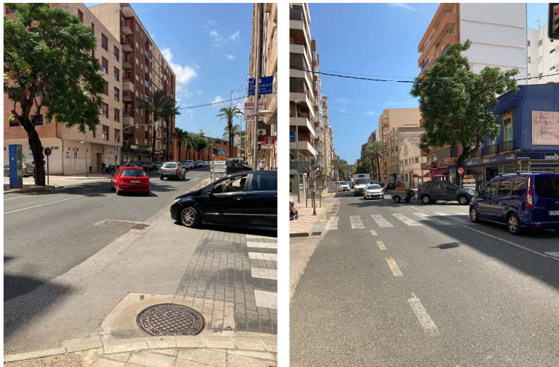
Figura 7A y 7B. Accesos directos desde calles a la travesía que bloquean los recorridos internos y dificultan la fluidez del tráfico.