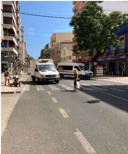
Figura 6. Numerosos cruces con peatones que dificultan la fluidez del tráfico y aumentan los tiempos de recorrido de la travesía.