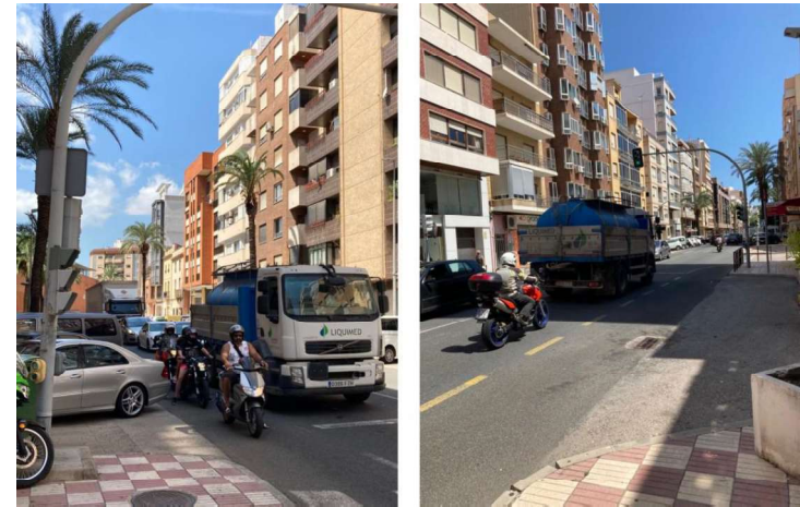
Figura 8A y 8B. Confluencia de tráfico pesado con motocicletas, generando situaciones de peligro, y a su vez, aumentando la contaminación y la congestión de la travesía.