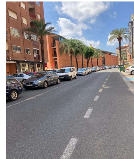
Figura 9. Retenciones habituales a lo largo de la travesía a causa de las intersecciones, pasos peatonales y zonas semaforizadas que aumentan los tiempos de recorrido y la contaminación acústica y de emisión de gases.