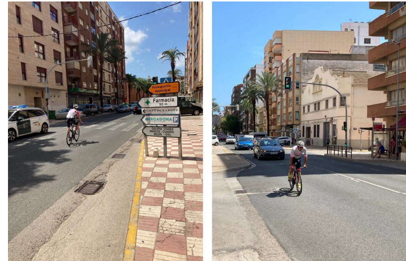
Figura 4A y 4B. Alta presencia de ciclistas en la calzada de la travesía debido a la inexistencia de carriles bici, que provoca situaciones de peligro con el tráfico rodado.