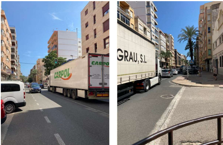
Figura 3A y 3B. Tráfico de pesados constante en la travesía, puesto que es el único recorrido existente para acceder al polígono industrial del exterior del municipio.