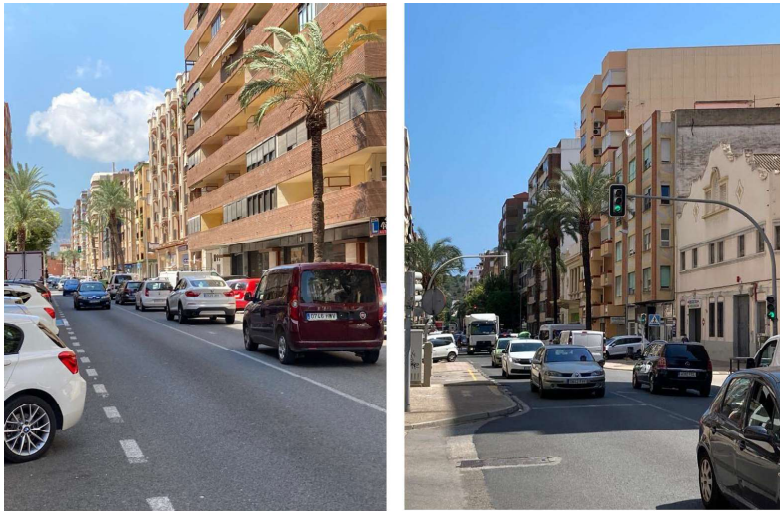
Figura 2A y 2B. Atascos de tráfico que conllevan un aumento de contaminación acústica y de emisión de gases perjudiciales para el municipio.