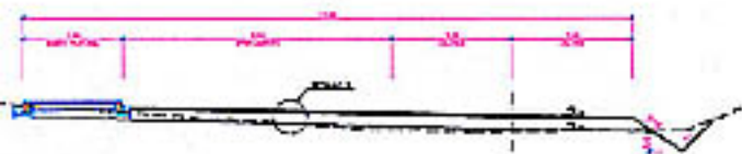
SECCION TPO EN RAMAL CON MARGUENTO Y ANCHO PEONAL RAMAL E2+P2+R1+D1 D=1/50