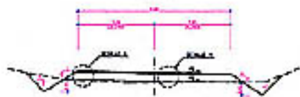
SECCION TPO EN RAMAL D1+11-CARRILES 1 x 2 D=1/50