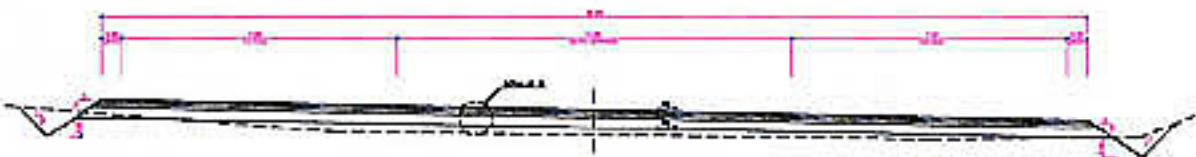
SECCION TIPO ROTUNDAS SIM. R. RADIO INTERIOR de 30m. 1-1/20