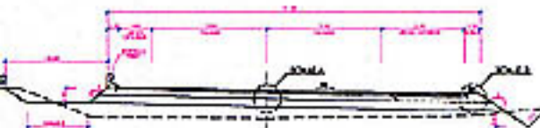
SECCION TPO EN RAMAL SIN R. P.R. 31400 AL 31300 D=1/50