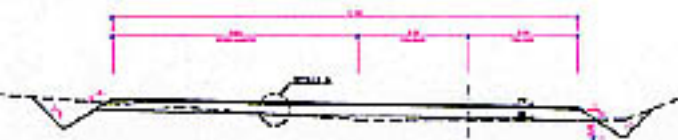
SECCION TPO EN RAMAL CON AMPLIAMENTO RAMAL F2 D=1/50