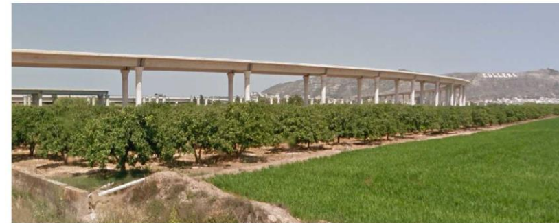
Figura 3. Ejemplo de posible solución de plataforma aérea del tramo entre poblaciones

Por todo lo expuesto, se considera que las medidas propuestas para la integración de este enlace son perjudiciales para Beniflà y su vecino Potries, motivo por el que se