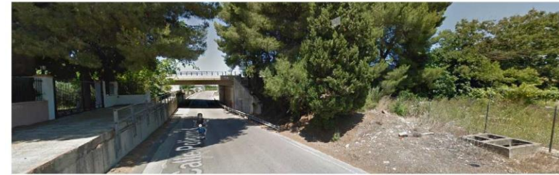
Figura 2. Ejemplo de talud con Vegetación entre las Poblaciones de Almoines y Beniarjó en el cruce a nivel de la AP7