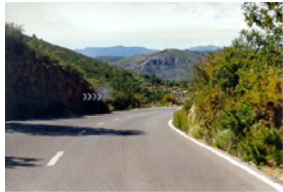
2.- No parece muy cerrada. Dejamos de acelerar