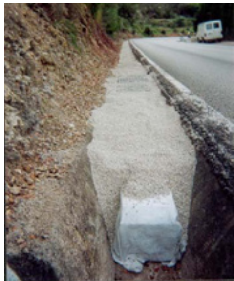
Cuneta modular en ejecución

En cuanto a las citadas cunetas modulares, con patente comercial en España, están constituidas por un “canal celular” envuelto en geotextil, y recubierto todo el conjunto por gravilla u otro material de alta drenabilidad. El resultado es una cuneta con la necesaria capacidad hidráulica (calculada previamente) y con un pequeño desnivel respecto de la superficie de rodadura, evitando discontinuidades de cota que puedan suponer un obstáculo.