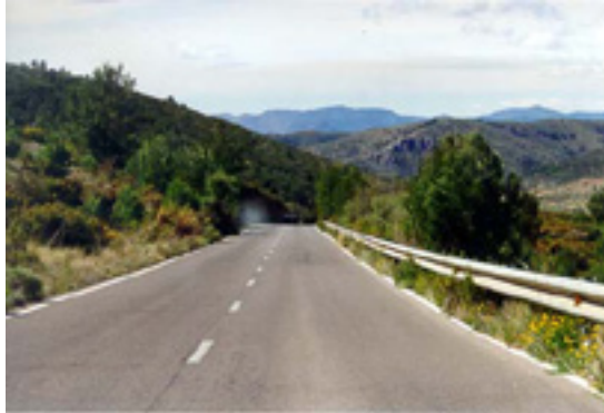
1.- Vamos por una recta. Se vislumbra una curva cerca