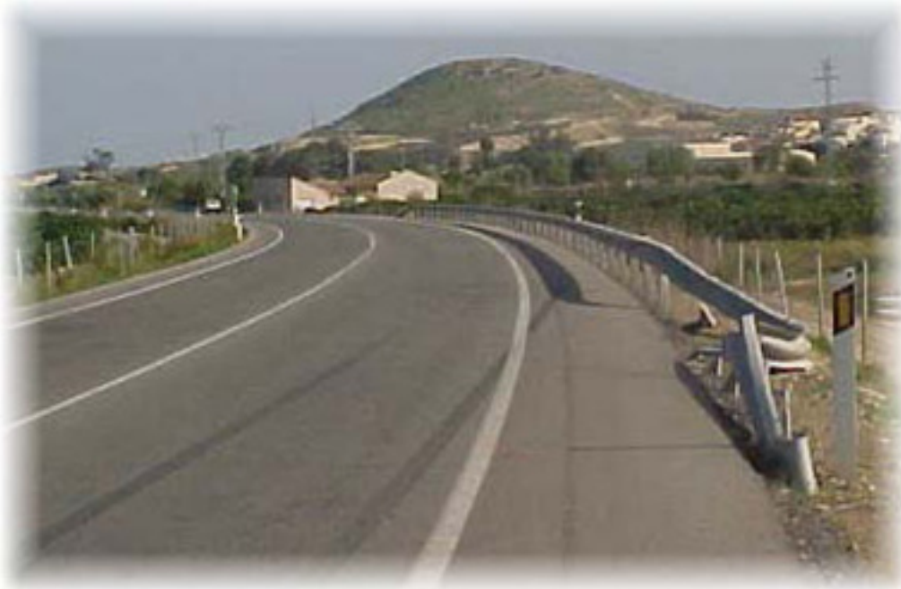
Bionda después de impedir una salida de vía

Del total de colisiones contra barrera de seguridad, en un 63% de ellas se producen víctimas, y un 7% son mortales. Estas cifras no hablan excesivamente bien de la seguridad que nos ofrece una barrera; de hecho, la mortalidad es superior a las salidas de vía sin barrera. Sin embargo, al analizar los 6 accidentes mortales que han tenido lugar en 2001 con barrera de seguridad, se observa que en tres casos se trataba de motocicletas (choque contra poste de la bionda), y en otro de un vehículo pesado que no es contenido por la barrera.