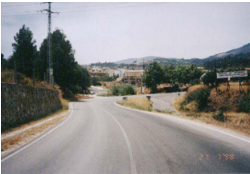
Desnivel importante sin proteger con barrera de seguridad

Resulta preocupante la altísima mortalidad existente en salidas de vía y posterior despeñamiento (un 26% de los accidentes mortales por salida de vía), sobre todo por lo indiscutible que resulta en estos casos la necesidad de la colocación de barrera de seguridad, además, con la debida antelación respecto del inicio del desnivel.