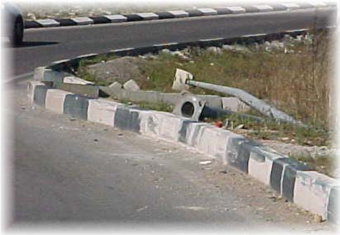
El problema no es la farola destrozada, sino el coche que impactó contra ella por no estar protegida