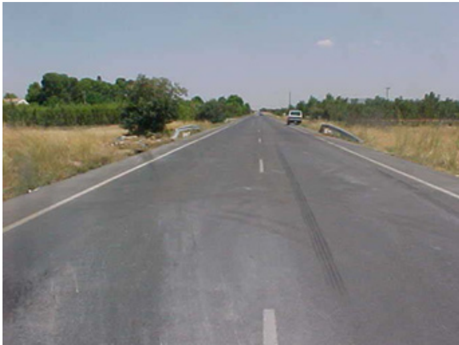
Salida de vía (hacia la izquierda) en una larga recta