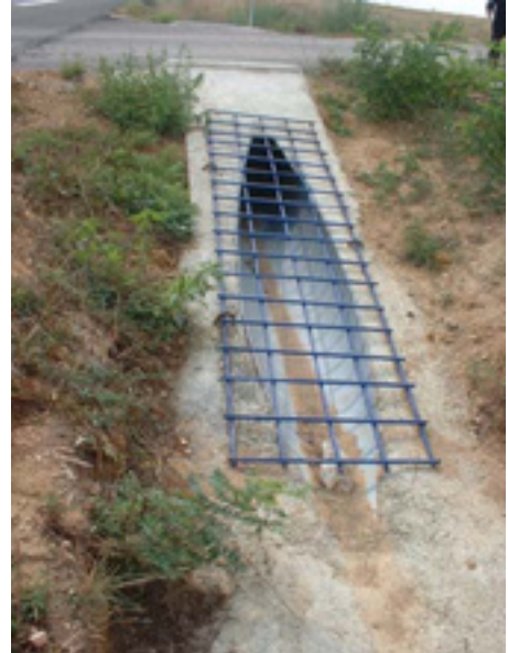
Paso salvacunetas en pico de flauta