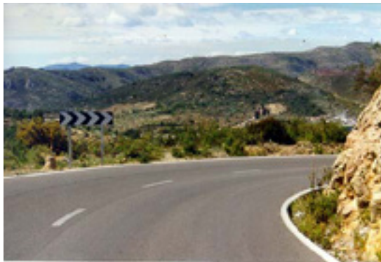
3.- Sin embargo, a mitad de curva, ésta se cierra