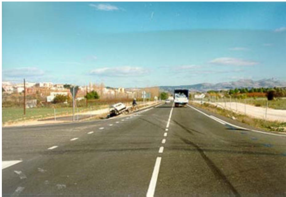
Salida de vía en Intersección para evitar un choque frontolateral contra un vehículo que irrumpe desde la secundaria

El problema de que se produzca la salida de vía es, por tanto, por un mal funcionamiento de la intersección, problemática cuyo tratamiento excede de los objetivos de este anexo.