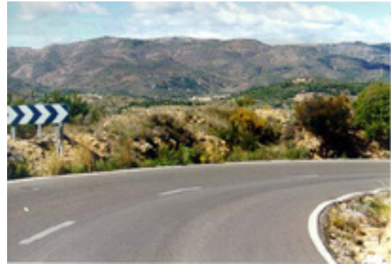
4.- Debemos frenar a fondo. A partir de ahí.....

Desde el Servicio de Seguridad Vial se detectan las acumulaciones de accidentes en determinadas curvas, y se propone su resolución, pero el hecho de que las salidas de vía se produzcan con cierta aleatoriedad dentro de la red, refuerza las razones anteriores.