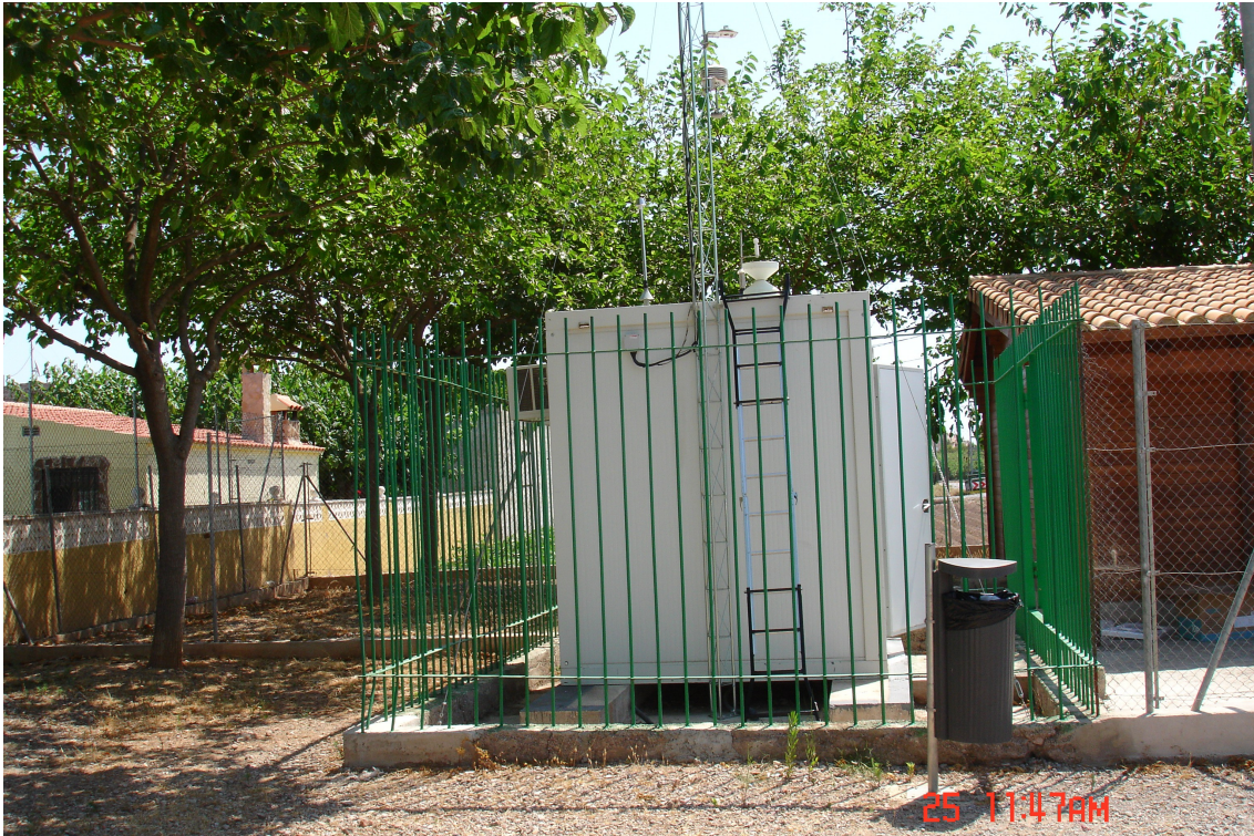
Foto: Estación de CASTELLÓ-GRAU.

También se lleva a cabo el análisis de metales como el Arsénico, Níquel, Cadmio y Plomo en la fracción PM 10 , así como del benzo(a)pireno y otro hidrocarburos aromáticos policíclicos, con el fin de ir adaptando la red a las exigencias venideras a causa de la entrada en vigor de la normativa que regula los niveles de concentración de arsénico, cadmio, mercurio, níquel e hidrocarburos aromáticos policíclicos en el aire ambiente.