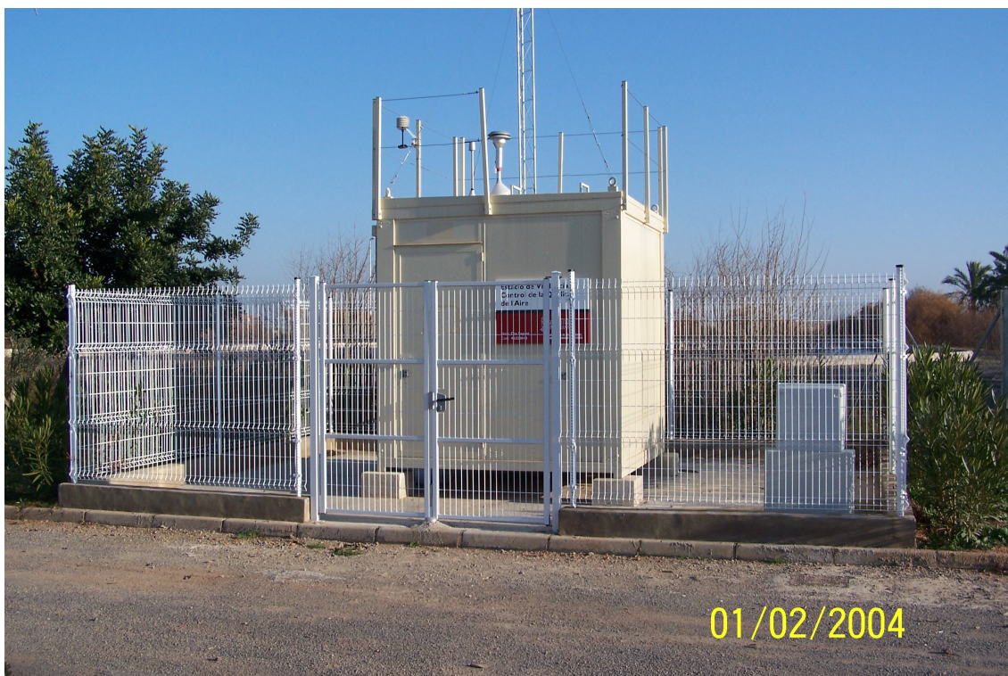
Foto: Estación de SAGUNT-CEA

También se lleva a cabo el análisis de metales como el Arsénico, Níquel, Cadmio y Plomo en la fracción PM_{10} , así como del benzo(a)pireno y otro hidrocarburos aromáticos policíclicos, con el fin de ir adaptando la red a las exigencias venideras a causa de la entrada en vigor de la normativa que regula los niveles de concentración de arsénico, cadmio, mercurio, níquel e hidrocarburos aromáticos policíclicos en el aire ambiente.