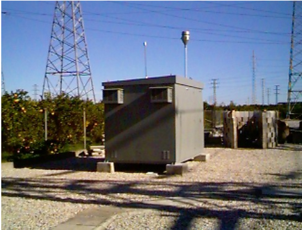
Foto: Estación de ALZIRA

También se lleva a cabo el análisis de metales como el Arsénico, Níquel, Cadmio y Plomo en la fracción PM_{10} , así como del benzo(a)pireno y otros hidrocarburos aromáticos policíclicos, con el fin de ir adaptando la red a las exigencias venideras a causa de la entrada en vigor de la normativa que regula los niveles de concentración de arsénico, cadmio, mercurio, níquel e hidrocarburos aromáticos policíclicos en el aire ambiente.