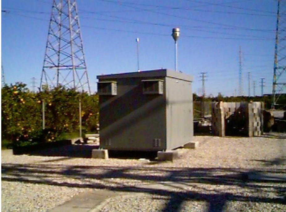
Foto: Estación de ALZIRA

También se lleva a cabo el análisis de metales como el Arsénico, Níquel, Cadmio y Plomo en la fracción PM 10 , así como del benzo(a)pireno y otros hidrocarburos aromáticos policíclicos.