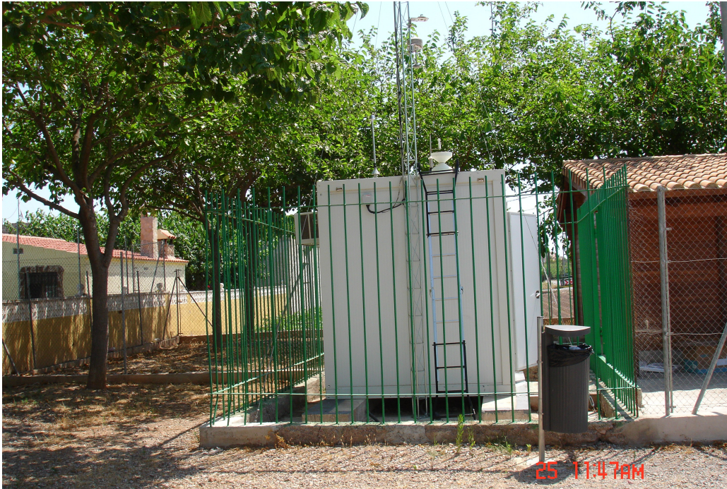
Foto: Estación de CASTELLÓ-GRAU.

También se lleva a cabo el análisis de metales como el Arsénico, Níquel, Cadmio y Plomo en la fracción PM 10 , así como del benzo(a)pireno y otros hidrocarburos aromáticos policíclicos.