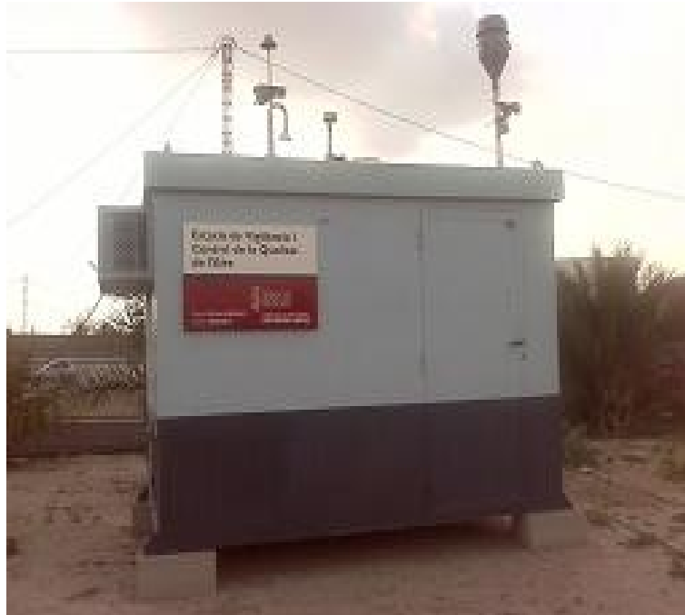
Foto: Estación de ELX-PARC DE BOMBERS

También se lleva a cabo el análisis de metales como el Arsénico, Níquel, Cadmio y Plomo en la fracción PM 10 , así como del benzo(a)pireno y otros hidrocarburos aromáticos policíclicos.