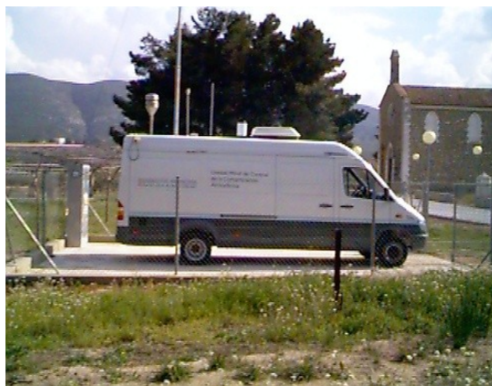
Foto: Unidad Móvil de ONTINYENT

La Red Valenciana de Vigilancia y Control de la Contaminación Atmosférica cuenta con tres unidades móviles y una Unidad de Intervención Rápida, las cuales, obtienen información sobre 11 emplazamientos repartidos en el área interior de la Comunidad Valenciana