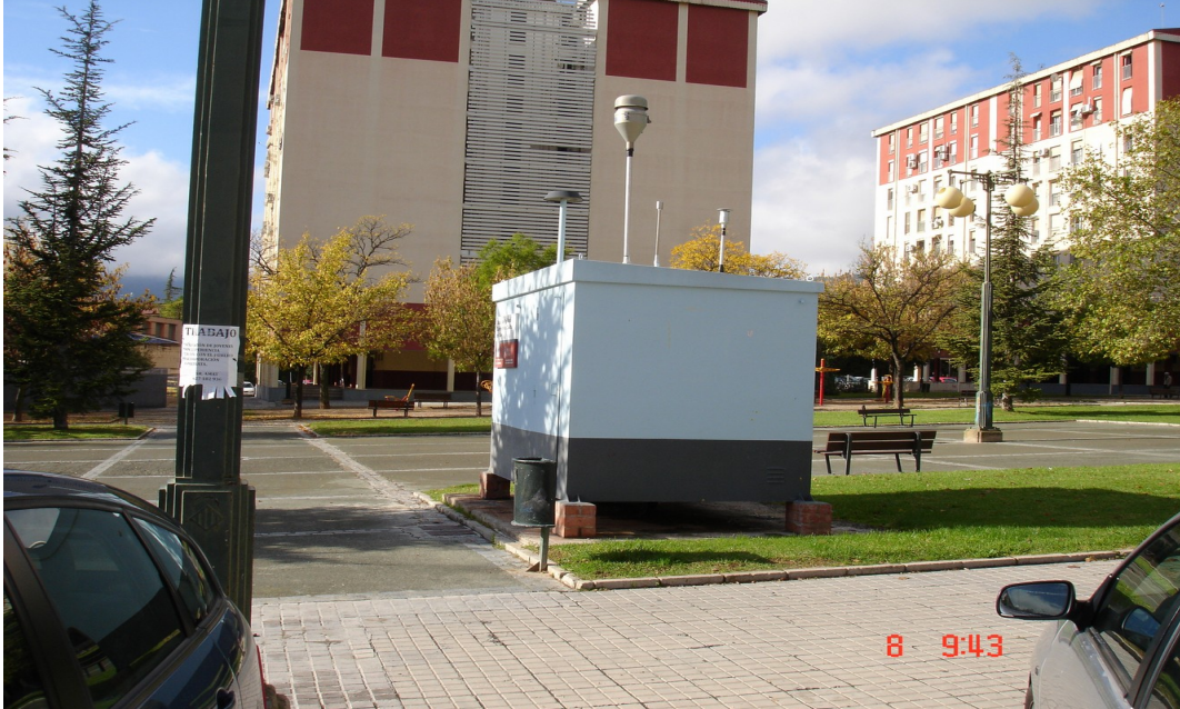
Foto: Estación de ALCOI-VERGE DELS LLIRIS

También se lleva a cabo el análisis de metales como el Arsénico, Níquel, Cadmio y Plomo en la fracción PM 10 , así como del benzo(a)pireno y otros hidrocarburos aromáticos policíclicos.