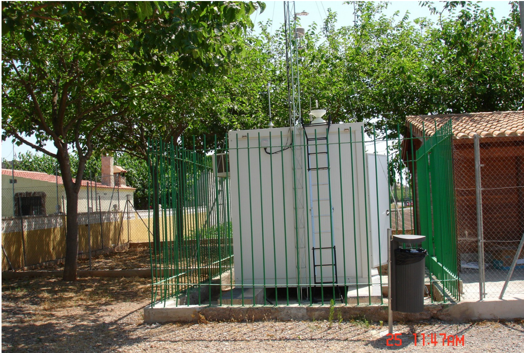
Foto: Estación de CASTELLÓ-GRAU.

También se lleva a cabo el análisis de metales como el Arsénico, Níquel, Cadmio y Plomo en la fracción PM 10 , así como del benzo(a)pireno y otros hidrocarburos aromáticos policíclicos.