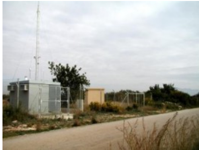
Foto: Estación de Sant Jordi

En algunas estaciones se dispone además de sensores para diferentes parámetros meteorológicos, como velocidad y dirección del viento, humedad relativa, radiación solar, presión atmosférica y precipitación. Estos parámetros son útiles para la interpretación de los datos y el conocimiento de la dinámica de los contaminantes en el seno de la atmósfera.