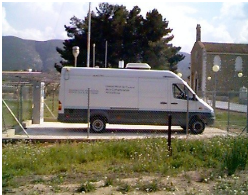
Foto: Unidad móvil en Ontinyent

La Red Valenciana de Vigilancia y Control de la Contaminación Atmosférica cuenta con tres unidades móviles y una Unidad de Intervención Rápida, las cuales, obtienen información sobre 11 emplazamientos repartidos en el área interior de la Comunidad Valenciana.