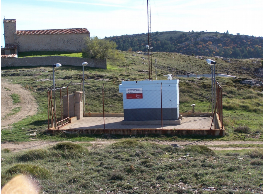
Foto: Estación de CORATXAR

En algunas estaciones se dispone además de sensores para diferentes parámetros meteorológicos, como velocidad y dirección del viento, humedad relativa, radiación solar, presión atmosférica y precipitación. Estos parámetros son útiles para la interpretación de los datos y el conocimiento de la dinámica de los contaminantes en el seno de la atmósfera.