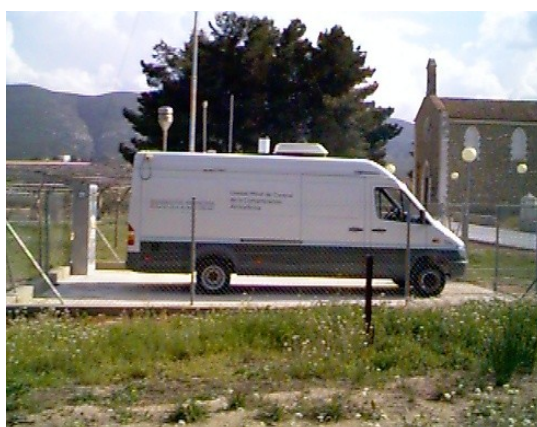
Foto: unidad Móvil de ONTINYENT

La Red Valenciana de Vigilancia y Control de la Contaminación Atmosférica cuenta con tres unidades móviles y una Unidad de Intervención Rápida, las cuales, obtienen información sobre 11 emplazamientos repartidos en el área interior de la Comunidad Valenciana