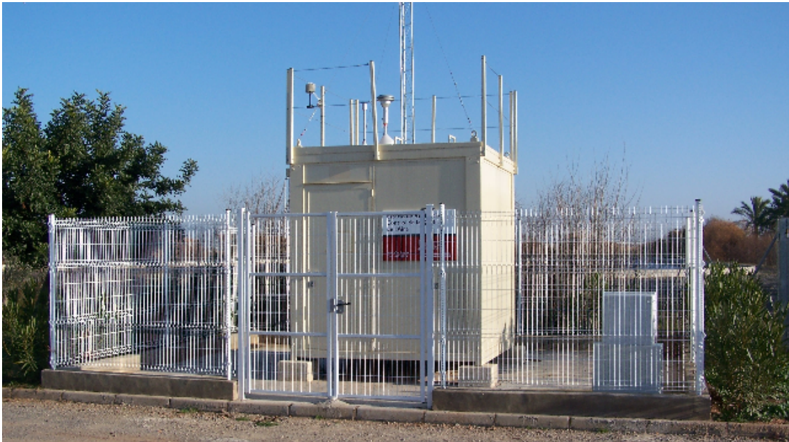
Foto: Estación de SAGUNT-CEA

En algunas estaciones se dispone además de sensores para diferentes parámetros meteorológicos, como velocidad y dirección del viento, humedad relativa, radiación solar, presión atmosférica y precipitación. Estos parámetros son útiles para la interpretación de los datos y el conocimiento de la dinámica de los contaminantes en el seno de la atmósfera.