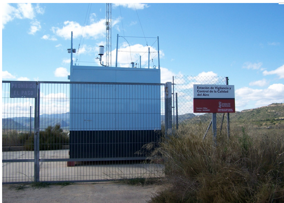
Foto: Estación de VILLAR DEL ARZOBISPO.

En algunas estaciones se dispone además de sensores para diferentes parámetros meteorológicos, como velocidad y dirección del viento, humedad relativa, radiación solar, presión atmosférica y precipitación. Estos parámetros son útiles para la interpretación de los datos y el conocimiento de la dinámica de los contaminantes en el seno de la atmósfera.