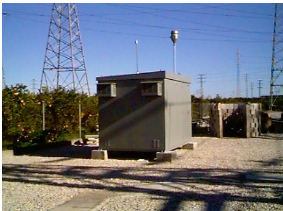
Foto: Estación de ALZIRA

En algunas estaciones se dispone además de sensores para diferentes parámetros meteorológicos, como velocidad y dirección del viento, humedad relativa, radiación solar, presión atmosférica y precipitación. Estos parámetros son útiles para la interpretación de los datos y el conocimiento de la dinámica de los contaminantes en el seno de la atmósfera.