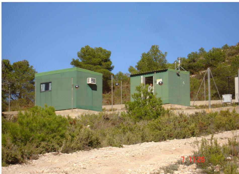
Foto: Estación de ZARRA

En algunas estaciones se dispone además de sensores para diferentes parámetros meteorológicos, como velocidad y dirección del viento, humedad relativa, radiación solar, presión atmosférica y precipitación. Estos parámetros son útiles para la interpretación de los datos y el conocimiento de la dinámica de los contaminantes en el seno de la atmósfera.