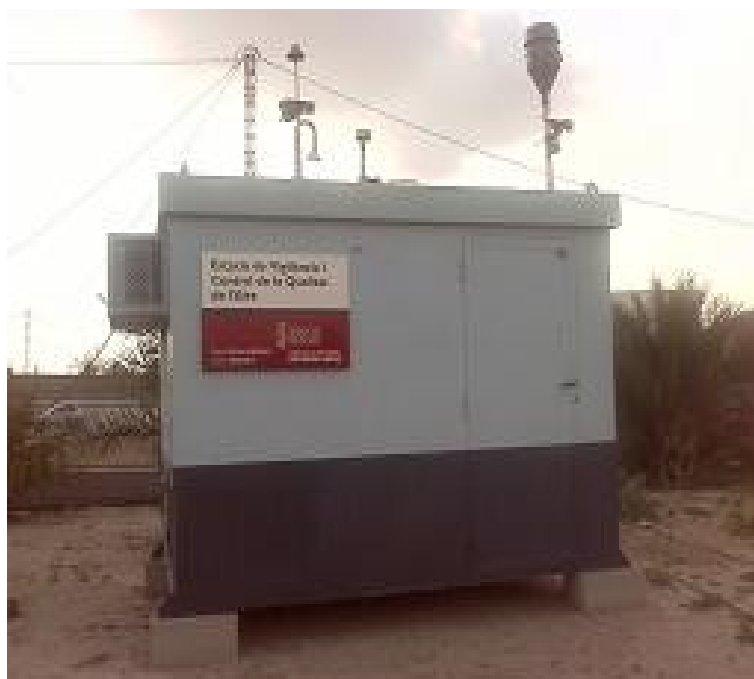
Foto: Estación de ELX-PARC DE BOMBERS

En algunas estaciones se dispone además de sensores para diferentes parámetros meteorológicos, como velocidad y dirección del viento, humedad relativa, radiación solar, presión atmosférica y precipitación. Estos parámetros son útiles para la interpretación de los datos y el conocimiento de la dinámica de los contaminantes en el seno de la atmósfera.