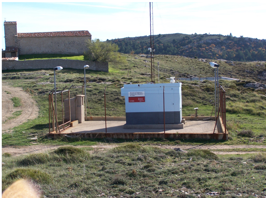
Foto: Estación de CORATXAR

En algunas estaciones se dispone además de sensores para diferentes parámetros meteorológicos, como velocidad y dirección del viento, humedad relativa, radiación solar, presión atmosférica y precipitación. Estos parámetros son útiles para la interpretación de los datos y el conocimiento de la dinámica de los contaminantes en el seno de la atmósfera.