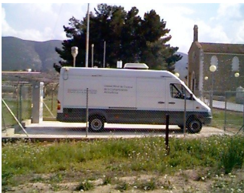
Foto: Unidad móvil en Ontinyent

La Red Valenciana de Vigilancia y Control de la Contaminación Atmosférica cuenta con tres unidades móviles y una Unidad de Intervención Rápida, las cuales, obtienen información sobre 11 emplazamientos repartidos en el área interior de la Comunidad Valenciana.