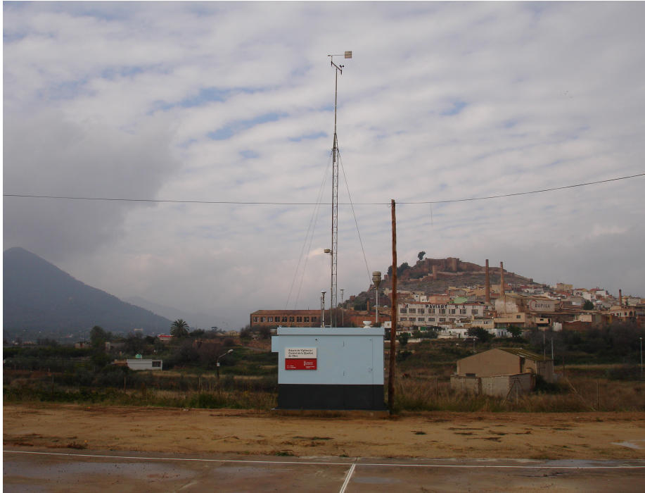
Foto: Estación de ONDA

En algunas estaciones se dispone además de sensores para diferentes parámetros meteorológicos, como velocidad y dirección del viento, humedad relativa, radiación solar, presión atmosférica y precipitación. Estos parámetros son útiles para la interpretación de los datos y el conocimiento de la dinámica de los contaminantes en el seno de la atmósfera.