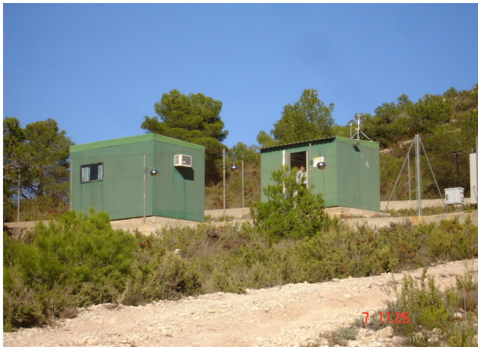
Foto: Estación de ZARRA

En algunas estaciones se dispone además de sensores para diferentes parámetros meteorológicos, como velocidad y dirección del viento, humedad relativa, radiación solar, presión atmosférica y precipitación. Estos parámetros son útiles para la interpretación de los datos y el conocimiento de la dinámica de los contaminantes en el seno de la atmósfera.