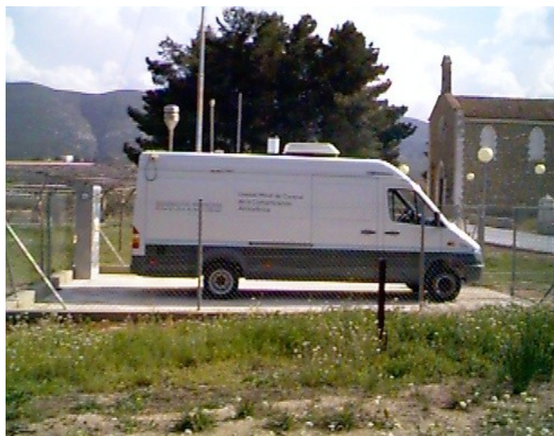
Foto: Unidad Móvil de ONTINYENT

La Red Valenciana de Vigilancia y Control de la Contaminación Atmosférica cuenta con tres unidades móviles y una Unidad de Intervención Rápida, las cuales, obtienen información sobre 11 emplazamientos repartidos en el área interior de la Comunidad Valenciana