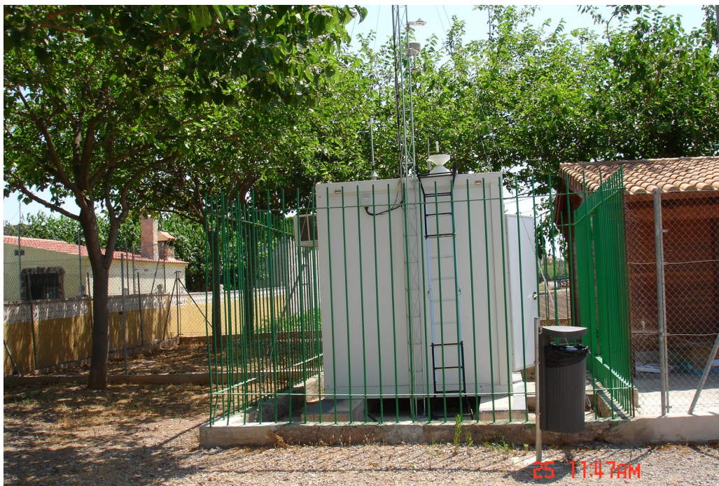
Foto: Estación de CASTELLÓ-GRAU.

En algunas estaciones se dispone además de sensores para diferentes parámetros meteorológicos, como velocidad y dirección del viento, humedad relativa, radiación solar, presión atmosférica y precipitación. Estos parámetros son útiles para la interpretación de los datos y el conocimiento de la dinámica de los contaminantes en el seno de la atmósfera.