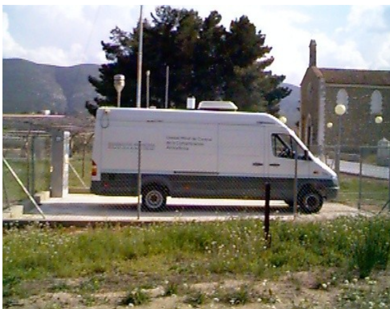
Foto: Unitat mòbil a Ontinyent

La Xarxa Valenciana de Vigilància i Control de la Contaminació Atmosfèrica compta amb tres unitats mòbils i una Unitat d'Intervenció Ràpida, les quals, obtenen informació sobre nou emplaçaments repartits en l'àrea interior de la Comunitat Valenciana.