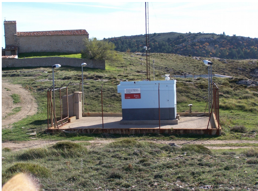
Estació a CORATXAR

En algunes estacions es disposa, a més, de sensors per a diferents paràmetres meteorològics, com la velocitat i la direcció del vent, la humitat relativa, la radiació solar, la pressió atmosfèrica i la precipitació. Aquests paràmetres són útils per a la interpretació de les dades i el coneixement de la dinàmica dels contaminants en el si de l'atmosfera.