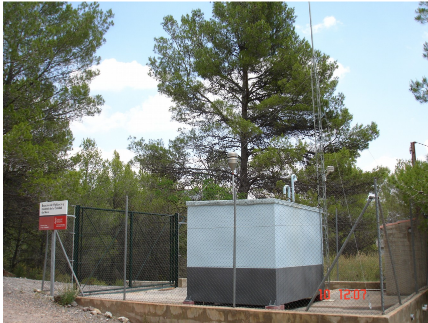
Foto: Estación de CIRAT

En algunas estaciones se dispone además de sensores para diferentes parámetros meteorológicos, como velocidad y dirección del viento, humedad relativa, radiación solar, presión atmosférica y precipitación. Estos parámetros son útiles para la interpretación de los datos y el conocimiento de la dinámica de los contaminantes en el seno de la atmósfera.