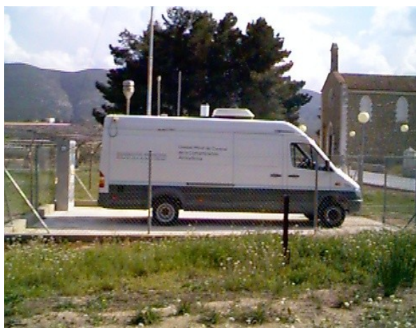
Foto: Unidad Móvil de ONTINYENT

La Red Valenciana de Vigilancia y Control de la Contaminación Atmosférica cuenta con tres unidades móviles y una Unidad de Intervención Rápida, las cuales, obtienen información sobre 9 emplazamientos repartidos en el área interior de la Comunidad Valenciana.