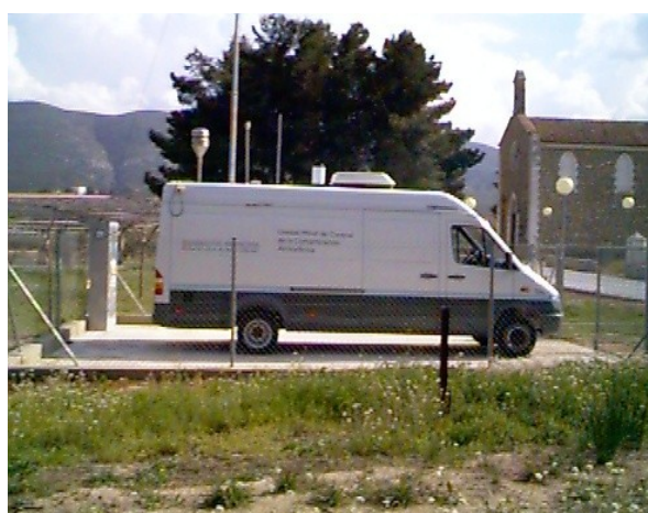
Foto: Unitat mòbil a Ontinyent

La Xarxa Valenciana de Vigilància i Control de la Contaminació Atmosfèrica compta amb tres unitats mòbils i una Unitat d'Intervenció Ràpida, les quals, obtenen informació sobre nou emplaçaments repartits en l'àrea interior de la Comunitat Valenciana.