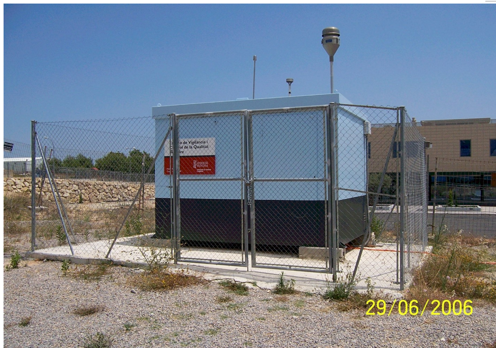
Foto: Estació a Paterna-CEAM

En algunes estacions es disposa a més de sensors per a diferents paràmetres meteorològics, com la velocitat i la direcció del vent, la humitat relativa, la radiació solar, la pressió atmosfèrica i la precipitació. Aquests paràmetres són útils per a la interpretació de les dades i el coneixement de la dinàmica dels contaminants en el si de l'atmosfera.