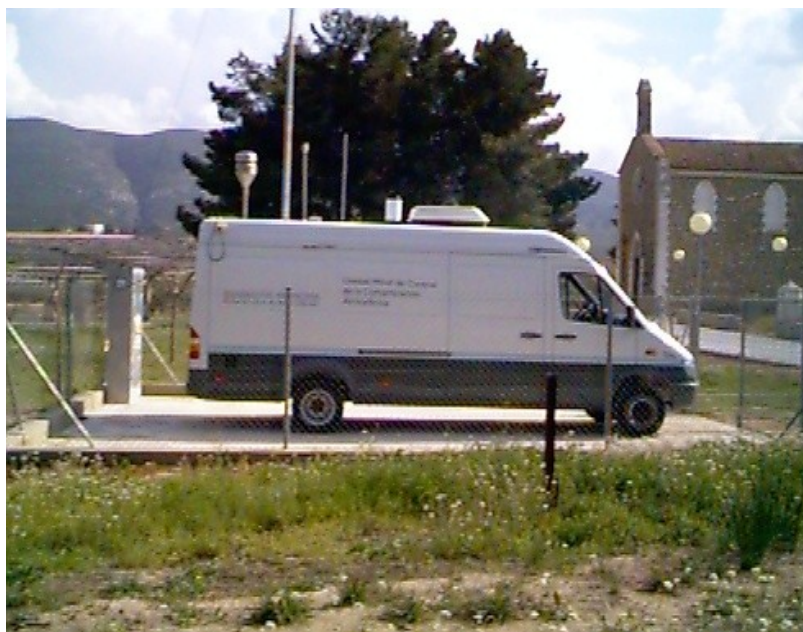
Foto: Unitat mòbil a ONTINYENT

La Xarxa Valenciana de Vigilància i Control de la Contaminació Atmosfèrica compta amb tres unitats mòbils i una Unitat d'Intervenció Ràpida, les quals, obtenen informació sobre nous emplaçaments repartits en l'àrea interior de la Comunitat Valenciana.