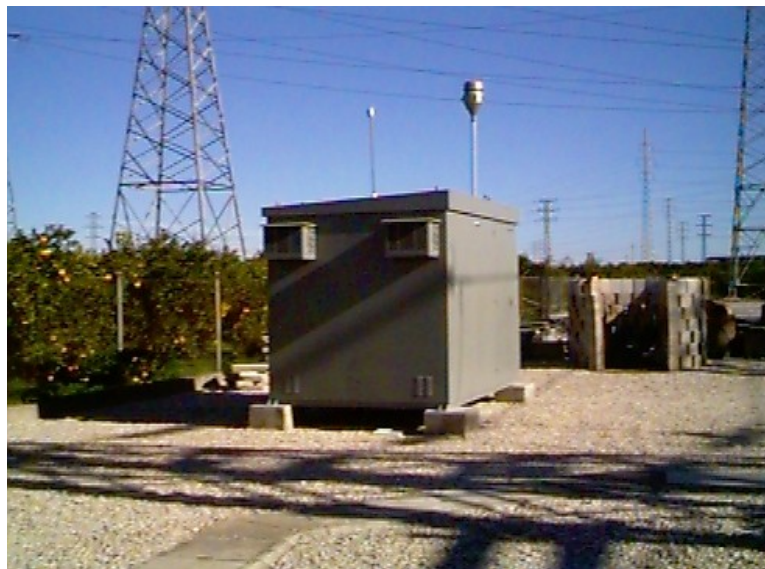
Foto: Estació a ALZIRA

En algunes estacions es disposa a més de sensors per a diferents paràmetres meteorològics, com la velocitat i la direcció del vent, la humitat relativa, la radiació solar, la pressió atmosfèrica i la precipitació. Aquests paràmetres són útils per a la interpretació de les dades i el coneixement de la dinàmica dels contaminants en el si de l'atmosfera.