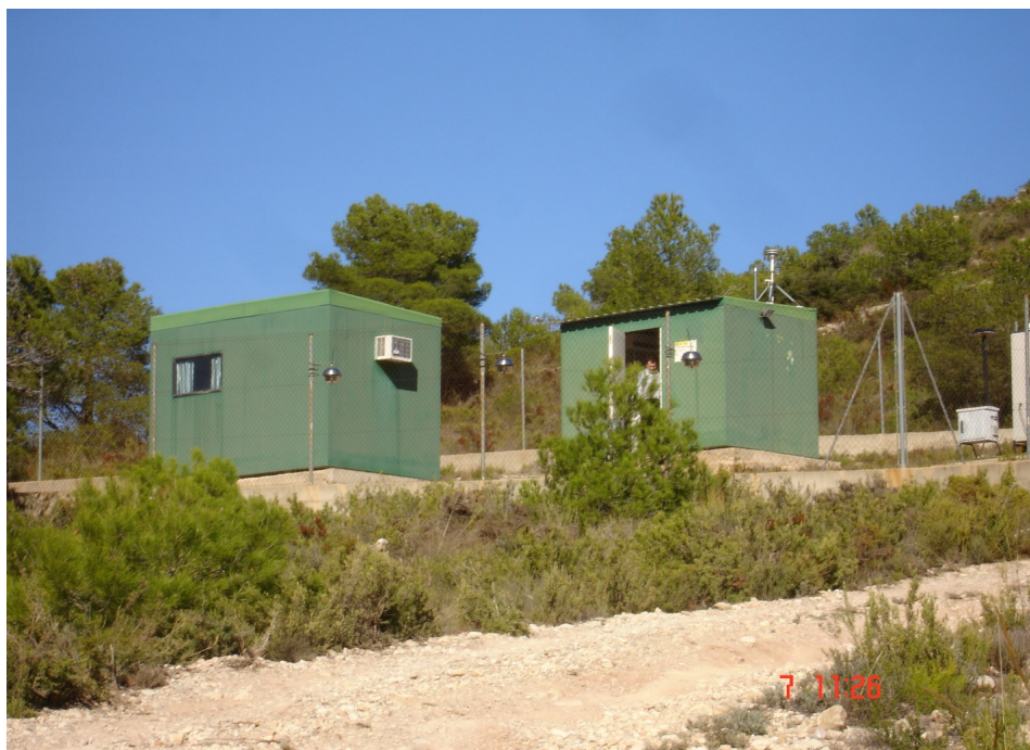
Foto: Estación de ZARRA

En algunas estaciones se dispone además de sensores para diferentes parámetros meteorológicos, como velocidad y dirección del viento, humedad relativa, radiación solar, presión atmosférica y precipitación. Estos parámetros son útiles para la interpretación de los datos y el conocimiento de la dinámica de los contaminantes en el seno de la atmósfera.