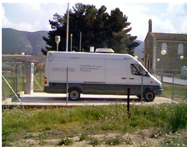
Foto: Unitat mòbil a ONTINYENT

La Xarxa Valenciana de Vigilància i Control de la Contaminació Atmosfèrica compta amb tres unitats mòbils i una Unitat d'Intervenció Ràpida, les quals, obtenen informació sobre nou emplaçaments repartits en l'àrea interior de la Comunitat Valenciana.