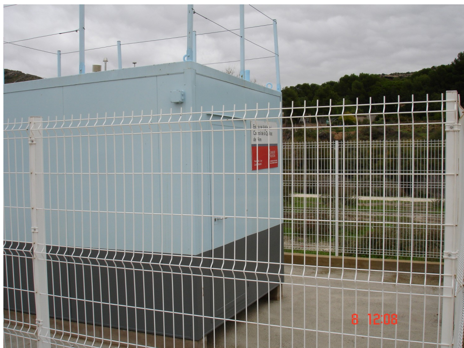
Foto: Estació a ELDA-LACY

En algunes estacions es disposa a més de sensors per a diferents paràmetres meteorològics, com la velocitat i la direcció del vent, la humitat relativa, la radiació solar, la pressió atmosfèrica i la precipitació. Aquests paràmetres són útils per a la interpretació de les dades i el coneixement de la dinàmica dels contaminants en el si de l'atmosfera.