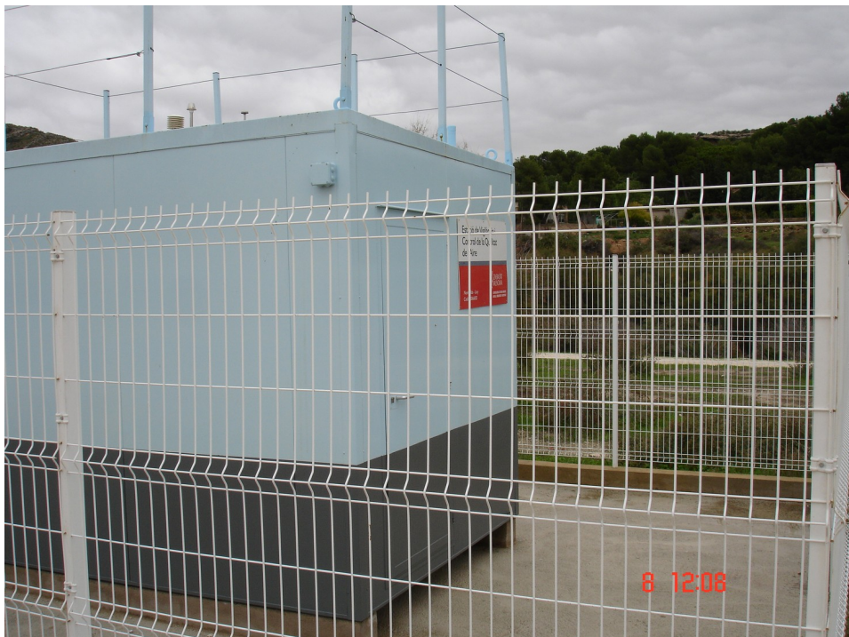
Foto: Estación de ELDA-LACY

En algunas estaciones se dispone además de sensores para diferentes parámetros meteorológicos, como velocidad y dirección del viento, humedad relativa, radiación solar, presión atmosférica y precipitación. Estos parámetros son útiles para la interpretación de los datos y el conocimiento de la dinámica de los contaminantes en el seno de la atmósfera.